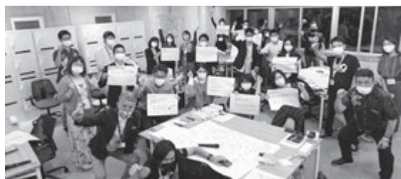
むらづくりに関するワークショップの様子（ハウリブ読谷残波岬店）

読谷村では、美しい自然と文化に囲まれた環境で仕事とリラックスを組み合わせたワーケーションが注目されています。クリエイティブなアイデアを生み出せる場所で、地元の人々との交流や伝統的な食事やアクティビティを楽しむこともできます。新たな刺激やインスピレーションを得ながら、仕事と生活のバランスを取れる新たな働き方は、観光としても成り立ち、地域への関心や地域との関わりを持つ村外居住者が「関係人口」として読谷村に継続的に関わるむらづくりを進めることが