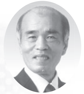
久米島町長 とうばる ひでお 桃原 秀雄

久米島町は、沖縄本島から西へ100キロメートルに位置し、那覇空港から飛行機で約30分、那覇泊港から船で約3時間で行くことができる。久米島町は、島の随所に優れた景勝地を擁するとともに歴史的、文化的遺産や風土的景観にも恵まれ島全体が県の自然公園に指定されている。2002年4月1日に、二つの村旧仲里村と旧具志川村が合併し久米島町となった。島の大きさは、59.11平方キロメートル（沖縄県では5番目に大きな島）で久米島・奥武島・オーハ島の有人島、および無人島の鳥島・硫黄島島を含む五島から構成されています。