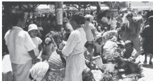
(1961年那覇中央市場)

上店舗が完成。日本復帰の1972年10月牧志第一公設市場がオープン。新しく生まれ変わったとして、“マチグラー”と呼ばれるようになったのでした。復帰当時の賑わいは私の記憶の中にもあります。あれから50年。コロナ規制も緩和され、「グラー」をとってもいいくらい賑わっています。