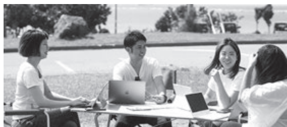
屋外での会議の様子（ハウリブ読谷残波岬店）