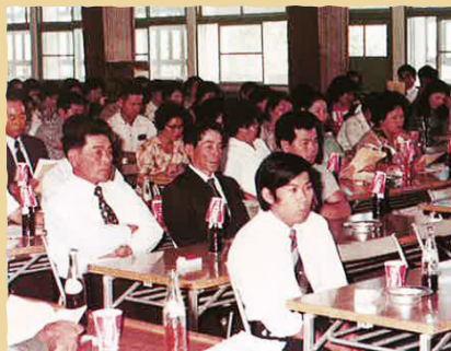
昭和51年度 通常総会(川平区公民館)