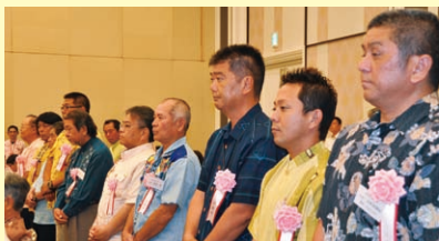
役員功労者表彰の様子