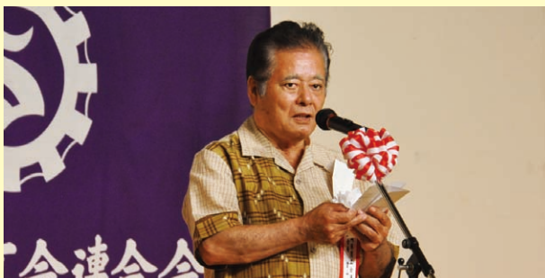
旭日双光賞受章の挨拶を述べる當山副会長