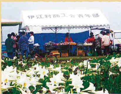
リリーフィールドにて青空市開催(平成6年)

今年度設立40周年を迎える商工会をご紹介します。 40年前各地の商工会はどんな様子だったのでしょう。 写真をもとに振り返ってみましょう。