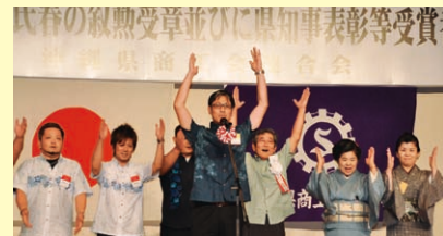
万歳三唱で締めくくる我喜屋副会長と 古波蔵県青連会長、長浜県女連会長と両部員の皆様