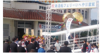
伊平屋村前泊港で開催された就航式

毎年10月に開催される月と併走するムーンライトマラソン」は、2014年は、10月11日(土)に開催が予定され、第20回の記念大会となり、参加者1,200名定員の申込み受付や島外からの観光客受入れの準備とPRが進んでいます。