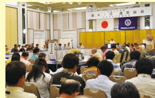
通常総会での議案審議の様子