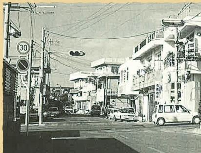
商店街中央メインストリート