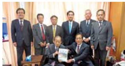
二階俊博：国土強靱化推進本部長への要請