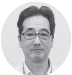
我喜屋 聡 沖食スイハン(株)