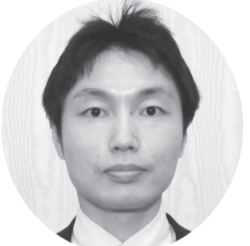
麻那古 大 株ジャンボリア