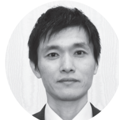
翁 和成 株柿安本店