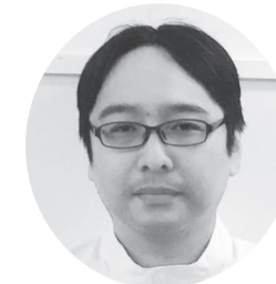
照喜納 桂 沖食スイハン(株)