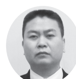
杜 以東 デリシャス・クック(株)