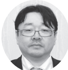
林 敏彦 株弁釜