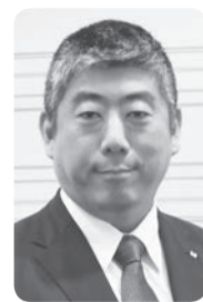
協会理事・教育専門委員長

(一社)日本惣菜協会では、会長・副会長と11人の理事が、全国各地でさまざまな協会活動を推進している。「理事VOICE」では、各理事の中食産業に込めた思いとその横顔を、シリーズで紹介する。