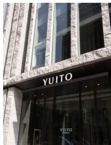
竣工写真:(上)外観、(右上)YUITOエントランスホール、 (右下)YUITOエントランス