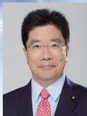
厚生労働大臣 加藤 勝信

一般社団法人日本塗装工業会が創立 70 周年を迎えられますことを心からお喜び申し上げます。 貴工業会は、設立以来、建設塗装工事の技術的進歩および改善はもとより、建築塗装業にかかわる人材の育成、技能者の地位向上に大きく貢献してこられました。歴代会長をはじめ関係各位のこれまでのご尽力に対し深く敬意を表する次第です。また、厚生労働行政の分野では、技能検定制度の充実等に多大なご協力を頂いており、厚く御礼申し上げます。