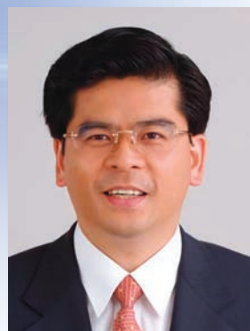
国土交通大臣 石井 啓一

この度、一般社団法人日本塗装工業会が創立 70 周年を迎えられましたことを、心よりお喜び申し上げます。