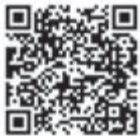
ウォーターセーフティガイド

カヌー、SUP(スタンドアップパドル)、ミニボート、水上オートバイや遊泳などのウォーターアクティビティについて、誰もが安全に安心して楽しむために知って欲しい情報をまとめた総合安全情報サイトです。