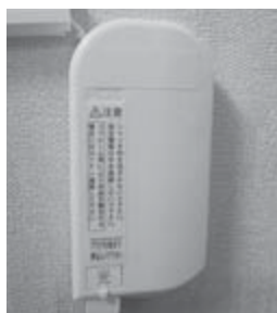
▲光コンセント写真

なお、平成29年の光回線スタート時に実施した分担金無料での光コンセント設置は、回線契約をしていただく前提で行っております。光コンセントを設置済みで回線契約をされていない方は、契約をしていただくようお願い致します。