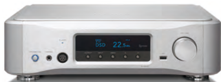
ネットワークDAC/プリ N-05XD