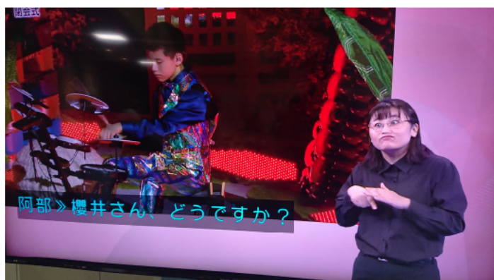
オリンピック閉会式とパラリンピック開閉会式で全編手話付きの放送