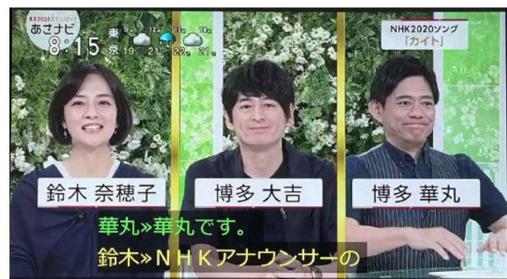
あさナビ「ぴったり字幕」を実施