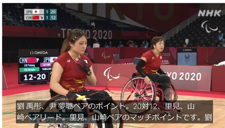
ロボット実況・字幕