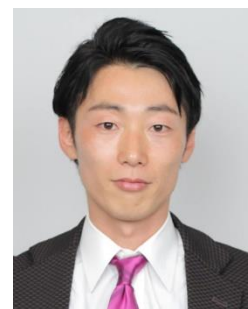
矢口 亨 カメラマン

19歳の時に一眼レフカメラを購入し、写真を始める。2010年サッカー南アW杯、12年ロンドン五輪などを取材。13年からプロ野球巨人担当。現在は東京五輪担当。「静かだけど心に届く写真が撮りたい」という熱い思いを抱いて、取材に励んでいらっしゃいます。