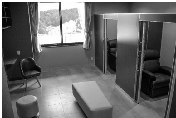
リラクゼーションルーム

地域での役割を担うべく地域の皆様と共に歩み、創り、成長していきたいと意気込んでおります。新たなチャレンジへ！