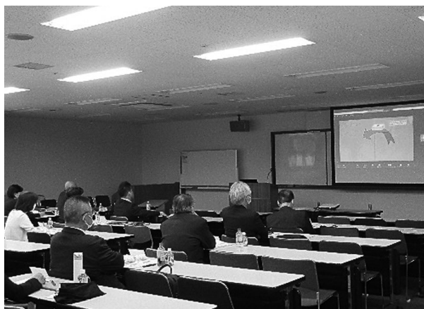
SDGs研修(オンライン研修)様子