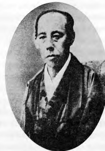
初代大蔵卿 松平慶永

この改革によって、会計官に代わって大蔵省が設置された。大蔵という古風な名称は、職員令の復古的性格に由来するものと思われる。大蔵省の長官たる大蔵卿の所管事務は「金穀出納、秩禄、造幣、營繕、用度等ノ事」と定められている。そして卿の下には、大輔、少輔、大丞、少丞以下の官職が設けられた。当時の官位相当表により、大蔵省内の職制を示すと第1-1表のとおりである。初代の大蔵卿は松平慶永、大蔵大輔は大隈八太郎(のちの重信)、少輔は伊藤俊輔(のちの博文)であった。ただし、大蔵省設置後約1ヵ月間は、大蔵卿のポストは空席であった。松平初代大蔵卿は2年8月12