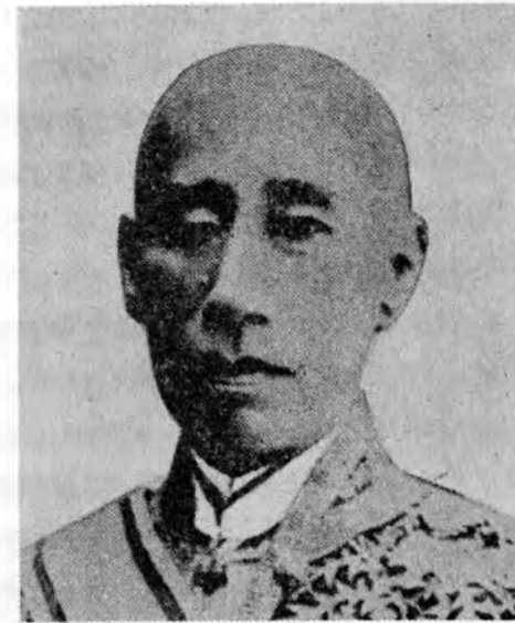
第2代大蔵卿 伊達宗城

蔵・民両省が分離されても、問題がこれで落ち着いたわけではなかった。大蔵省の組織問題や首脳人事をめぐって、藩閥間の政治的対立はなお続いていし、内政、財政を担当する機関を、どのような組織にするかも確定されてはいなかった。明治4年にはいると、三条・岩倉・大久保・木戸らの指導者により、廃藩置県の準備が始められるが、この大事を目前にして、諸省の機構整備が問題とされるにいたった。特に明治4年6月25日参議に就任した木戸は、制度改革を主張し