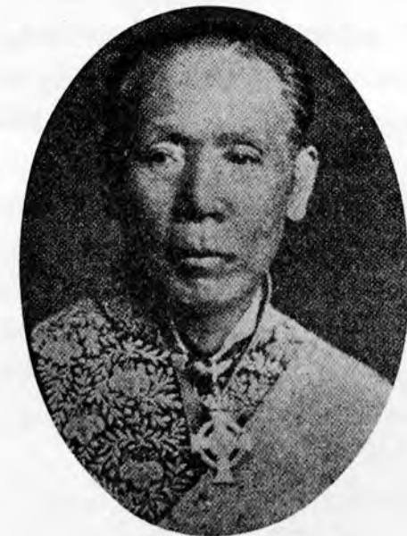
第5代大蔵卿 佐野常民

明治10年の改正直後、西南戦争が始まり、内政派はこの戦争で主導権を獲得するが、これまで徐々に進められてきた国家財政の基礎固めは、戦争により先へ延ばされることになる。大蔵省は大隈のもとで財政の建直しと通貨の処理にあたるが、この間、政治的には大隈と薩長藩出身者との対立が、しだいに激しさを増してゆく。この対立がおもな原因で、13年2月28日、参議と卿の分離が決められ、参議として大蔵卿を兼ねていた大隈は、その兼任を解かれることになった。ここに明治6年以来約7年間続いてきた大隈大蔵卿時代は終りを告げ、代わって佐野常民が大蔵卿となった。翌14年10月12日には、いわゆる14年の政変が起こり、大隈らは下野して、薩長藩閥を中心とする政権が出現した。大隈らの下野と同時に国会開設の詔勅が出され、新政権は憲法制定、国会開設への準備を旨として政治体制の強化にとりかかった。10月21日には太政官中に参事院を置いて、いっさいの法令の起草や各省への統制を行なわせるとともに、参議と卿の兼任制を復活する人事異動を行なった。この異動により、松方正義が大蔵卿と参議を兼ねることになった。