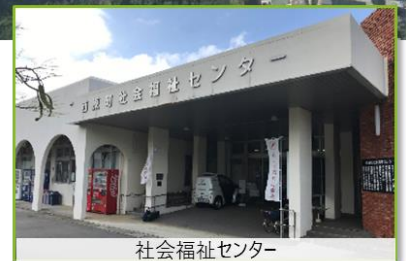
社会福祉センター