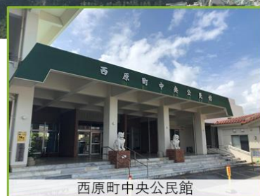
西原町中央公民館