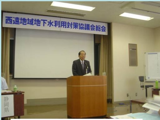
地下水利用対策協議会総会