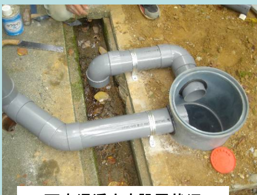
雨水浸透ます設置状況