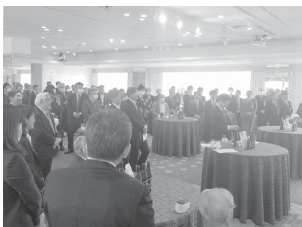
記念パーティーにご出席の皆様方