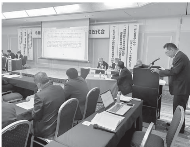
プロジェクターを使用して議案審議を行いました