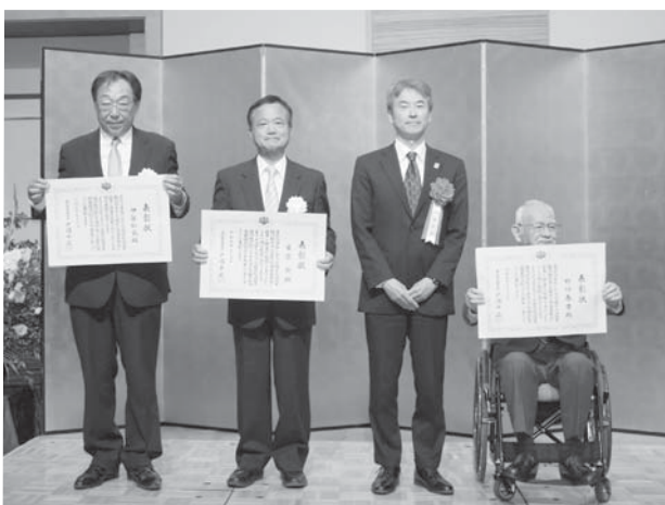
東北経済産業局長賞を受けた3名の理事の皆様