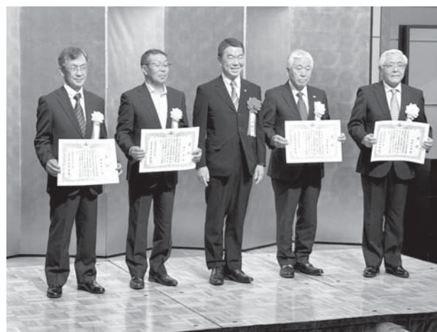
宮城県知事褒章を受けた4名の理事の皆様