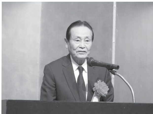
森 洋全石連会長より御祝辞