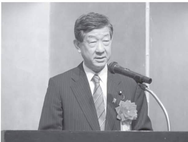
伊藤信太郎衆議院議員より御祝辞