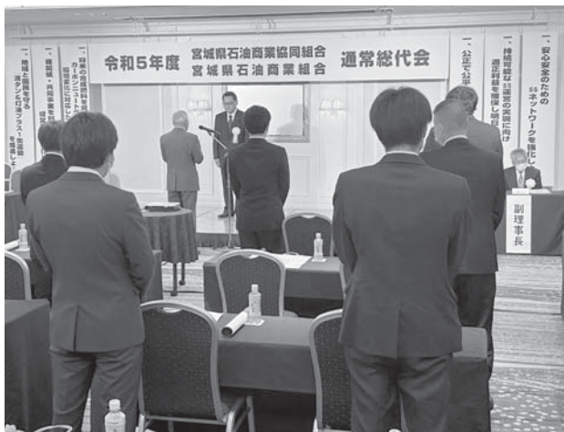
表彰式参列の優秀組合員・優秀従業員の皆様