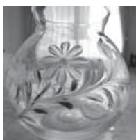
ツールペイント (講師作品)

身近な生活小物(木、布、紙、硝子素材)に用意してある図案を写し、主に花などを描いて楽しみます。初心者の方は簡単なお品から始めますので、安心して挑戦してください。いつでもお気軽に体験できます。