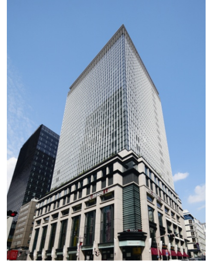
室町東三井ビルディング

※平面駐車場。「室町古河三井ビルディング」、「室町ちばぎん三井ビルディング」の竣工後は、別途、一体の地下駐車場が利用可能。竣工に伴い、別棟タワーパーキング (114 台) は解体予定。