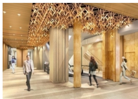
COREDO 室町3 内観（イメージパース）