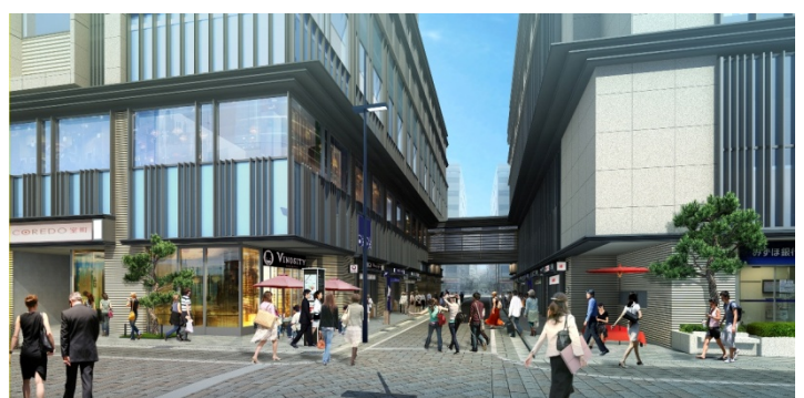
「仲通り」イメージパース