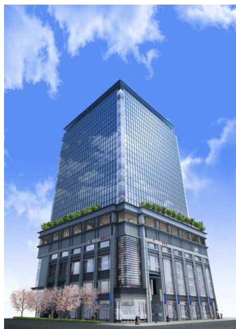
室町ちばぎん三井ビルディング (イメージパース)