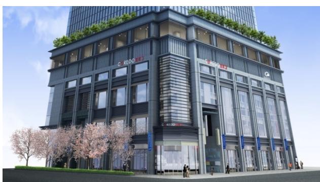
「COREDO 室町3」外観イメージパース