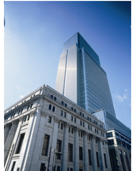
日本橋三井タワー