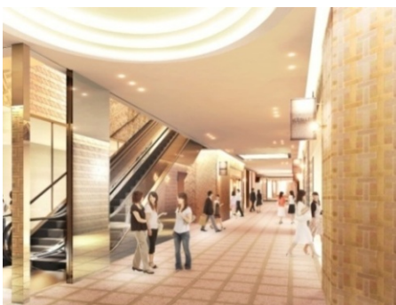
COREDO 室町2 内観（イメージパース）