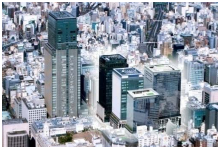
日本橋室町東地区開発計画（イメージパース）