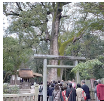
伊弉諾神宮 夫婦クス