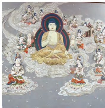
有志八幡講 阿弥陀聖衆来迎図