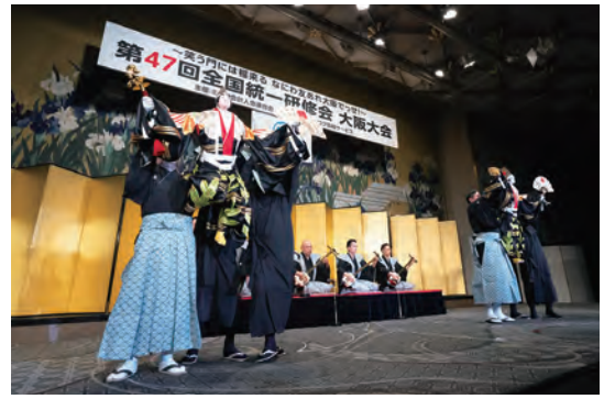
人形浄瑠璃文学座

露され、リズムカルに、時にユーモラスに舞い踊る三番叟、後半は「種蒔き」という場面では舞台を降りテーブルを回り、幸せの種を蒔いていただきました。