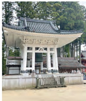
大塔の鐘 (高野四郎)