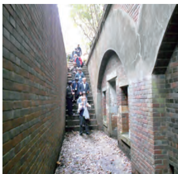
深山砲台 棲息掩蔽部跡