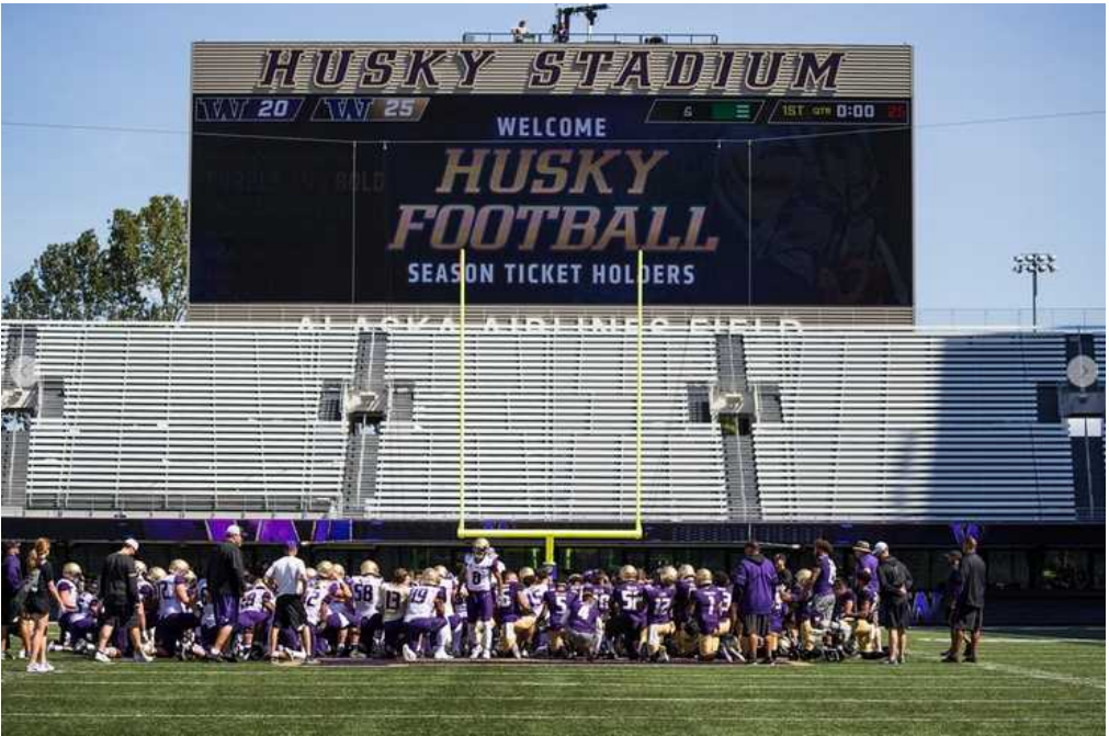
Husky Stadium (アメリカンフットボール)