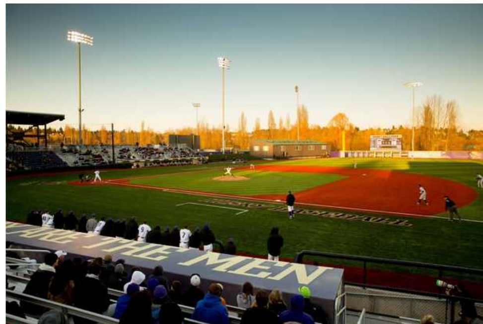
Husky Ballpark (ベースボール)