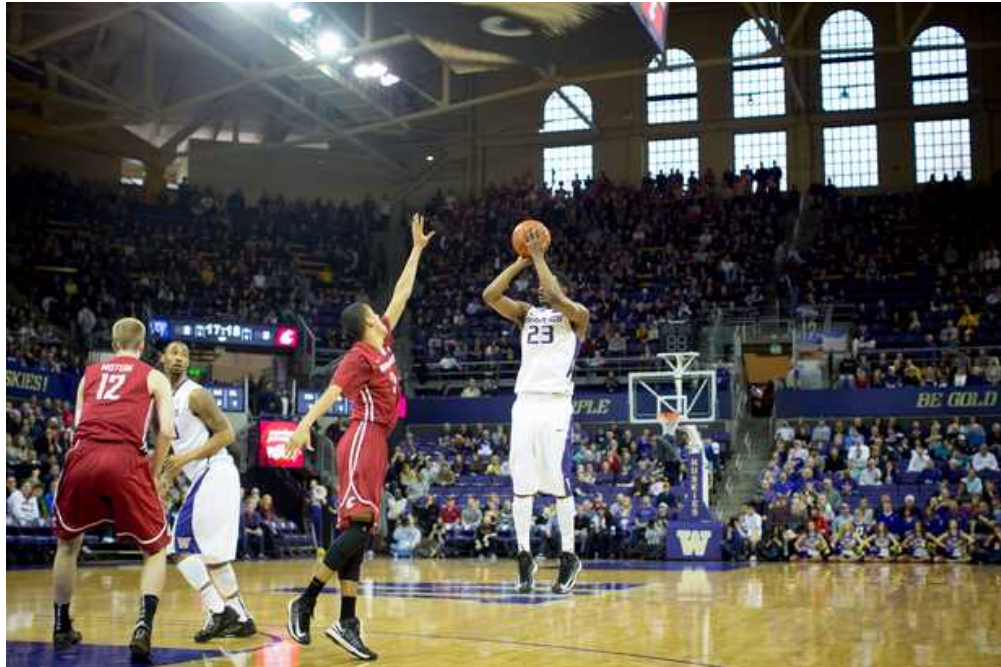
Alaska Airlines Arena (バスケットボール)