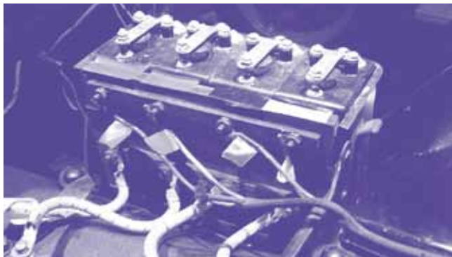
【図1】 T型の点火装置：パイブレータ（蓋を開けたところ）

T型のエンジンの排気量は約2900cc、出力は20馬力です、現在の同程度の排気量のエンジンは200馬力程度を発生しますから、T型のエンジンはそれより1桁程度、非力ということになりますが、その基本機構は現在のものとあまり変わりません。丁寧にエンジンフードを開けてみてください。現在の車のボンネットの中と異なり、エンジンルームはすかすかですから、少し車の知識をお持ちの方なら、どれが何の部品なのか一目瞭然だと思います。現在のエンジンと大きく異なるところは電装です。点火プラグへの配線が出ている黒い金属製の箱の中には、パイブレータという点火装置【図1】が入っています。金属の片持ち梁が電磁石によって、その名の通り振動して接点をオン／オフさせ、点火に必要な高電圧を発生させます。