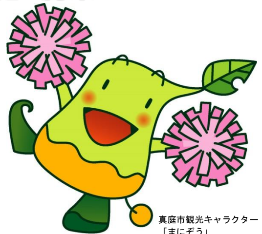
真庭市観光キャラクター 「まにぞう」