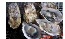
福岡のブランド水産物「唐泊恵比須牡蠣」