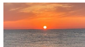
西浦漁港から眺める夕陽は地元漁師さえも魅了する美しさ。