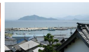
栄西が開祖した東林寺から眺める唐泊漁港の風景は万葉歌碑に詠まれ当時を偲ばれる。