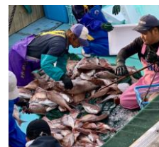
西浦漁港で水揚げされる玄界灘の鯛