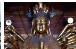
福岡三大観音の一つ「小田観音」728年に聖武天皇の勅願寺として建立