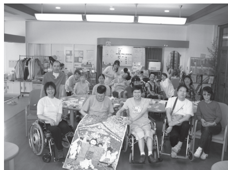
視覚障害者の方も作業しやすいように配慮して作った貼り絵が完成しました

今後も、利用をご希望されている視覚障害者の皆様の全部をお受けすることは難しいと思いますので、それぞれの地域のデイサービスで不自由なく楽しんでいただけるよう、このような形でお手伝いをしていきたいと考えています。