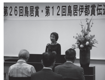
ご家族への思いをかみしめながらのお話が印象的でした

主人と結婚したのは、今から40数年前です。私が主人のことを言うのは少し恥ずかしいのですが、主人はたいへんな努力家で、闘争心のある人でもあります。ですから、この40数年間、私にとっては精一杯の月日でした。今日、元気につつがなく日々を送っているのは、職員や主人の両親、家族、心から支援くださった大勢の皆様のおかげと心にしみております。