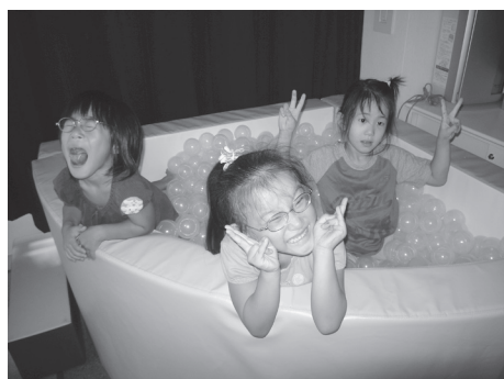
お友達と一緒に入ると楽しさが倍増！

た。保護者の願いに応え、子ども達の持つ力を伸ばしていくよう、これからも療育に励みたいと思います。（木村 佳子）