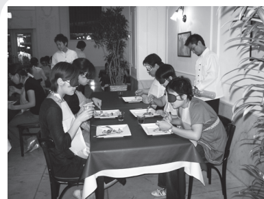
これは何かな? 1つ1つ確認しながら口へ運ぶ