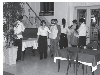
目隠しをして席に案内される。緊張のはじまり