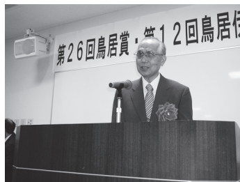
博物館の作品をご披露され、皆で触れさせていただきました

「百聞は一見にしかず」とか「一目瞭然」などと言いますが、視覚障害者にとっては「百聞は一触にしかず」、「一触瞭然」となるのではないかと考えています。これは、私の「手で見る博物館」の信条でもあります。視覚障害者は、触ることによって初めて自分の知識を確認することができるのだと思います。私は、触ることによって視覚障害者の世界が必ず広がると確信しています。