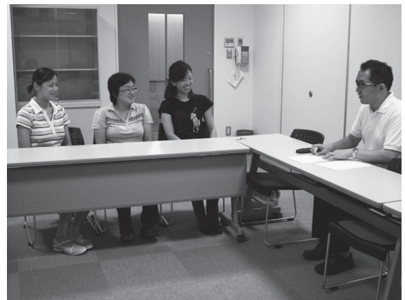
インタビューに会話が弾むお三方

一般の幼稚園に通うようになってから言葉が進んだようです。お母さんたちにも親子ともども温かく接していただけるのでありがたく思っています。家では、聞いた曲を覚えてピアノを弾くことが楽しいようで、苦心しながらも弾いています。