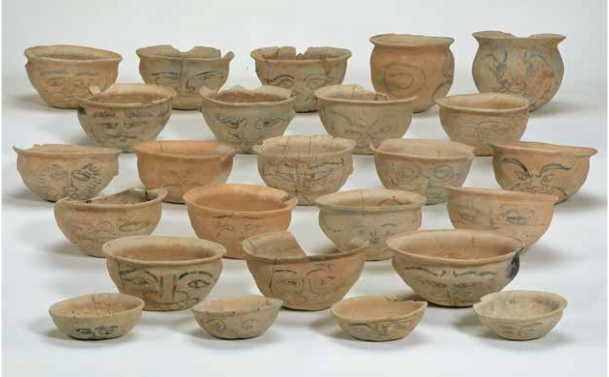
出土した人面墨書土器

怒った顔、泣いた顔、とりすました顔・・・多彩な表情のオンパレード。人面墨書土器 じんめんぼくしよどき とよばれる素焼きの土器の側面に墨描きされた古代人の顔である。その数約200。