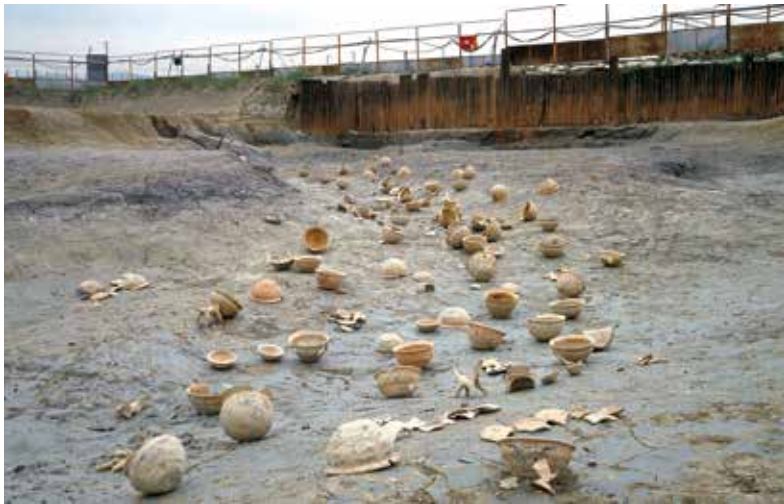
川の下流から橋を望む

奥のほうに橋脚の木材が見える。人面墨書土器などの遺物は橋から流されて川底に堆積した。遺物は接合・復元したもの。