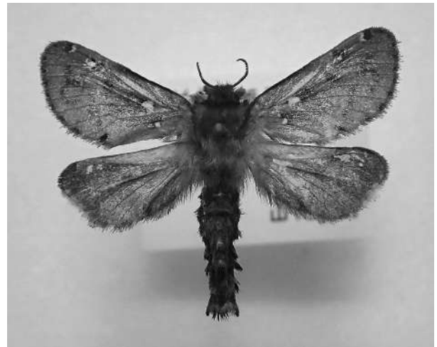
写真3 シロテンコウモリ Palpifer sexnotatus