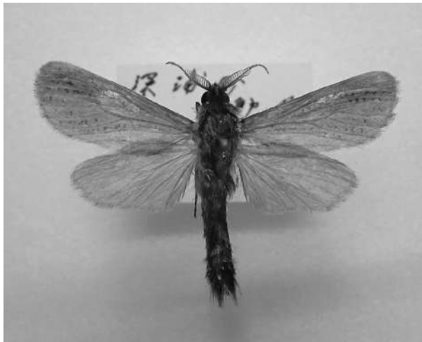
写真2 ハイイロボクトウ Phragmataecia castaneae