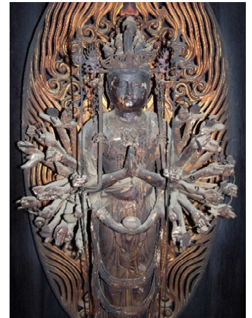
十一面観音立像(鎌倉時代) 中院町文化財保存会 (京都市指定文化財)