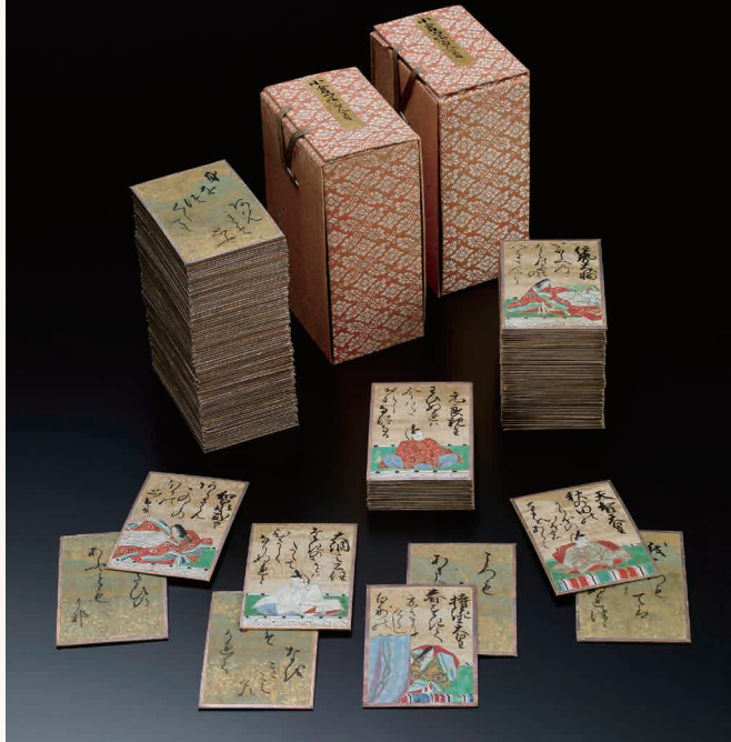
道勝法親王筆 百人一首かるた 江戸時代 兵庫・滴翠美術館蔵