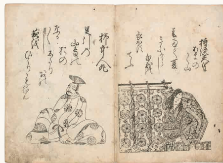
素庵本模刻画 百人一首 江戸時代 埼玉・跡見学園女子大学図書館蔵 ※会期中、展示頁の変更があります。