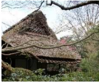
厭離庵 時雨亭 大正 12 年(1923)