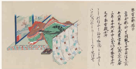
佐竹本三十六歌仙絵巻(複製)より斎宮女御 明治34年(1901) 個人蔵