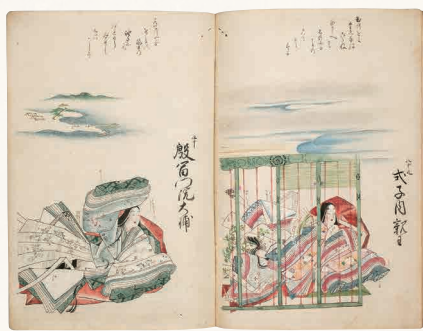
狩野探幽模写画 百人一首画帖 江戸時代 埼玉・跡見学園女子大学図書館蔵 ※会期中、展示頁の変更があります。