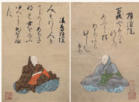
長谷川宗園画 百人一首手鑑 江戸時代 小倉百人一首文化財団蔵