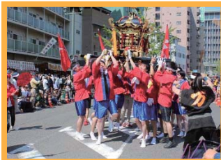
呉みなと祭のパレードに参加

日々の業務に加え、地域のお祭りやイベントに参加して、地域の方のお手伝いをする・盛り上げることも地域貢献しています。