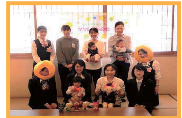
育休中の職員向けセミナーの様子

女性の育休取得率は100%。育休中もフォローを行い、復帰しやすい環境づくりに努めています。また呉市広に認定保育園を設けており、職員のお子さんも受入れています。