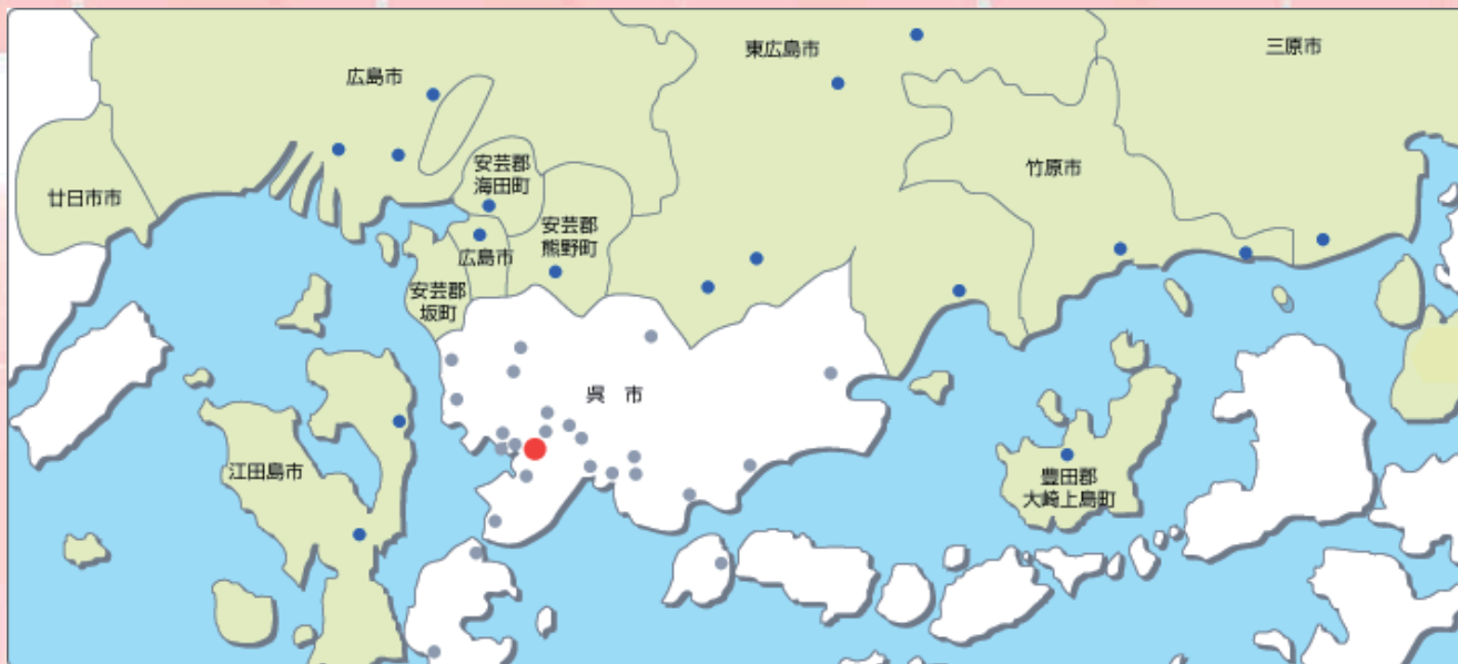
店舗配置図 ○印が店舗を表しています。●は本店