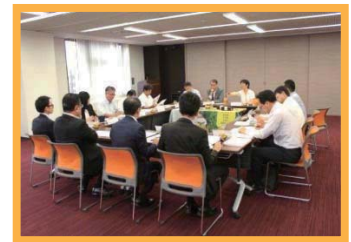
創業支援ネットワーク