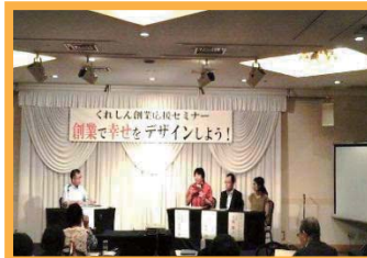
くれしん創業応援セミナー