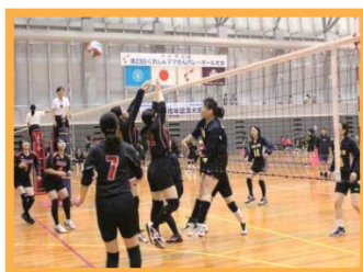
バレー部の試合の様子

職場や年齢を超えて、同じ趣味を持つ者同士が親睦を深めています。 例) ゴルフ部、ボランティア部、野球部、テニス部、陸上部、サッカー部ほか