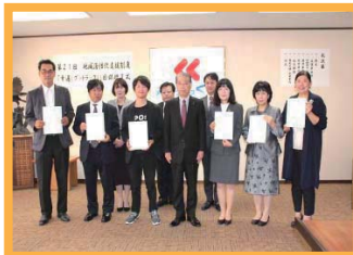
アクティブベースくれの助成金交付式

くれしんが全面支援するNPO法人を通じて助成金をお渡ししたり、創業セミナーを開催したり、商工会議所等他の団体と創業支援ネットワークを作るなど、創業に関するさまざまな機会を提供しています。