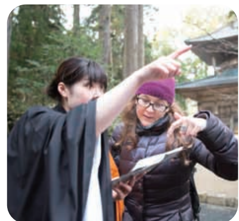
イタリア人に得意な英語で道案内

A7 まだ未熟者なので、正直成長の実感はありません。今後、忍耐強く、心の広い人間に成長したいと思っています。