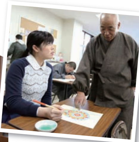
真言密教特殊講義A:得意な仏画の授業

A3 二つ目は真言密教特殊講義Aです。美術が好きで、仏教独特の仏画は筆だけで描くのが、やったことのない美術のジャンルなので、興味がすごく持てました。二つ目は条幅制作Aです。書道の授業といえば、半紙に書くというイメージが強いですが、この授業では、半切や二・八といった自分より大きな紙に書くので、新たな発見が出来る楽しいです。