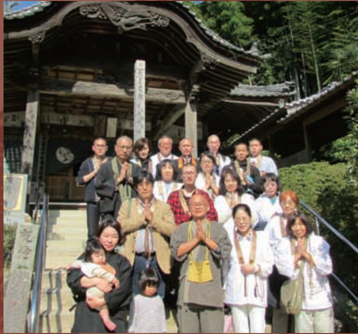
栄福寺(四国八十八ヶ所 第五十七番札所) 石鎚山 成就社