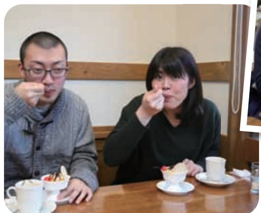
書道部の仲間と打ち合わせ