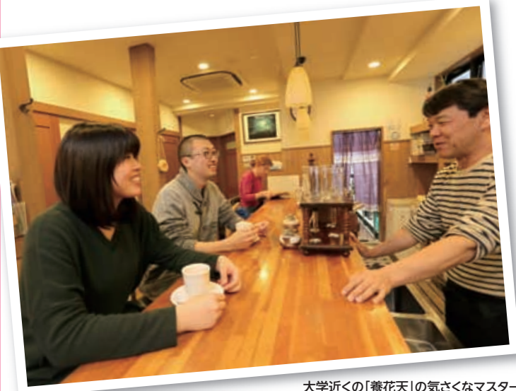
大学近くの「養花天」の気さくなマスター

A10 他では味わえないこの環境で、お大師様の教えを学ばせて頂ける有難く勿体ないチャンスだと私は思います。一緒にお大師様の最大限の教えを学ばせて頂きましょう!!