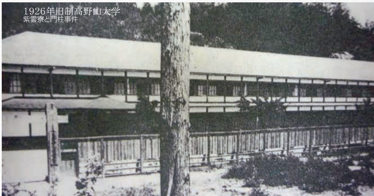
1926年旧制高野山大学 紫雲寮と門柱事件

前号で本学の敷地が、上の段と称された飲食店や商店が立ち並んでいた場所で、昭和の初めにそれらが鶯谷へ移転した跡地にできたのが、現在の本学であると紹介した。その大学の敷地となった上の段に、最初に建設されたのが昭和4年(1929)5月に開館式を迎えた図書館で、その半年後の同年11月には旧校舎が完成したことも前号で紹介した。