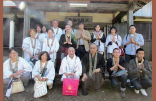
石鎚山・奥前神社

宿が見つからず、この橋の下で空腹のまま野宿したところであり、遍路が橋を渡る時には杖を突かないという風習はここで生まれた。「ゆきなやむ浮世の人を渡さずば一夜も十夜の橋と思ほゆ」との歌から、この橋の名がつけられた。橋の下で般若心経を唱え、考えにふけた。お大師さまが、寒くないように掛けられた布団や衣装が色彩豊かであり、温かい心を感じた。岩屋寺は、息が切れるほど登った山の上であり、標高700m、奇峰が天を突き、巨岩の中腹に埋め込まれるように堂宇が佇み、山岳霊場であった。二日目は、まず石手寺に向かった。この寺は、有名な右衛門三郎の民話があり、生まれ変わったとき右手に持っていた小石が展示されていた。栄福寺のご住職は、『ボクは坊さん。』の主人公である。ご夫婦とも、高野山大学の卒業生であり、お話しも伺い、和気あいあいとした時間が流れた。帰りのバスの中では、声明をお聞きするというありがたい幸運に感謝した。好天に恵まれ、佐藤先生ほか職員の皆様のすばらしい心配りに感謝し、多方面の様々な方の協力に感謝申し上げます。