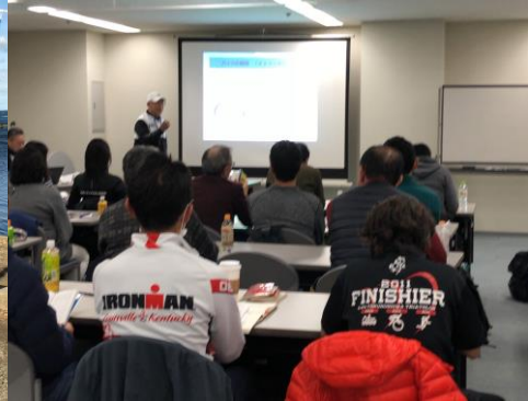
左/中：福井しあわせ元気国体2018 右：JTU公認審判員認定試験/講習会