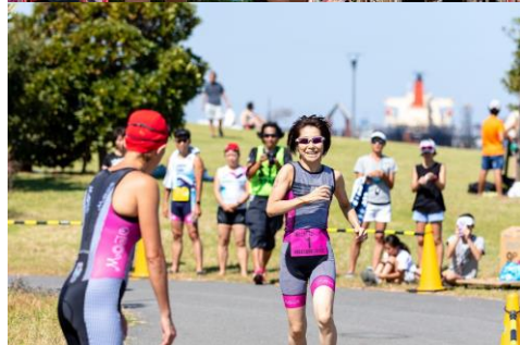
上/中：横浜シーサイド大会 下：川崎アクアスロン大会