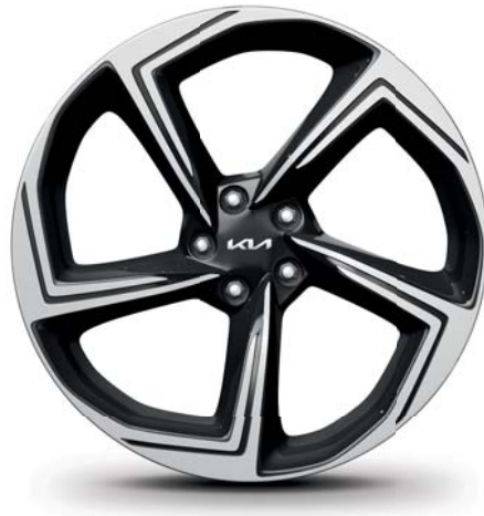
EV6 GT Leichtmetallfelgen 21 Zoll mit 255/40 R21 Bereifung