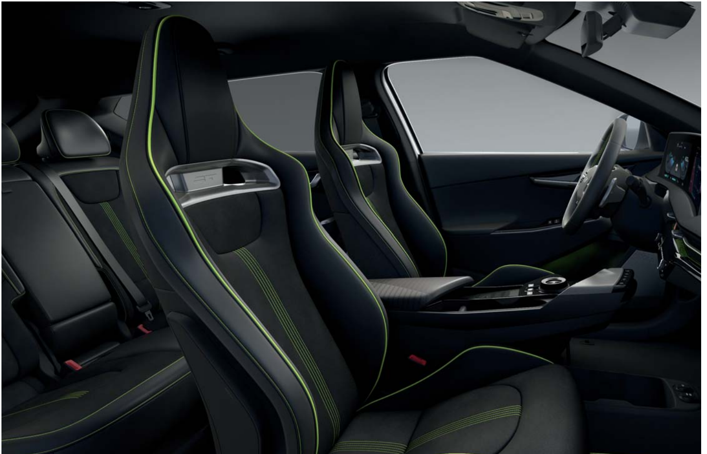
EV6 GT WK - Schwarz mit grünen Highlights Veloursledersitze im GT-Design