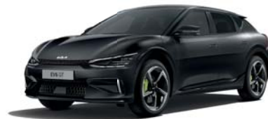
Aurora Black (ABP) 3