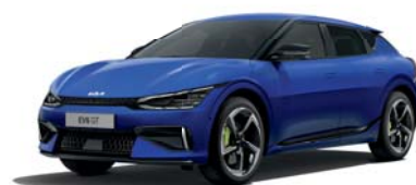
Yacht Blue (DU3) *2