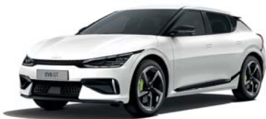
Snow White Pearl (SWP) 3