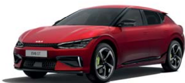
Runway Red (CR5) 2