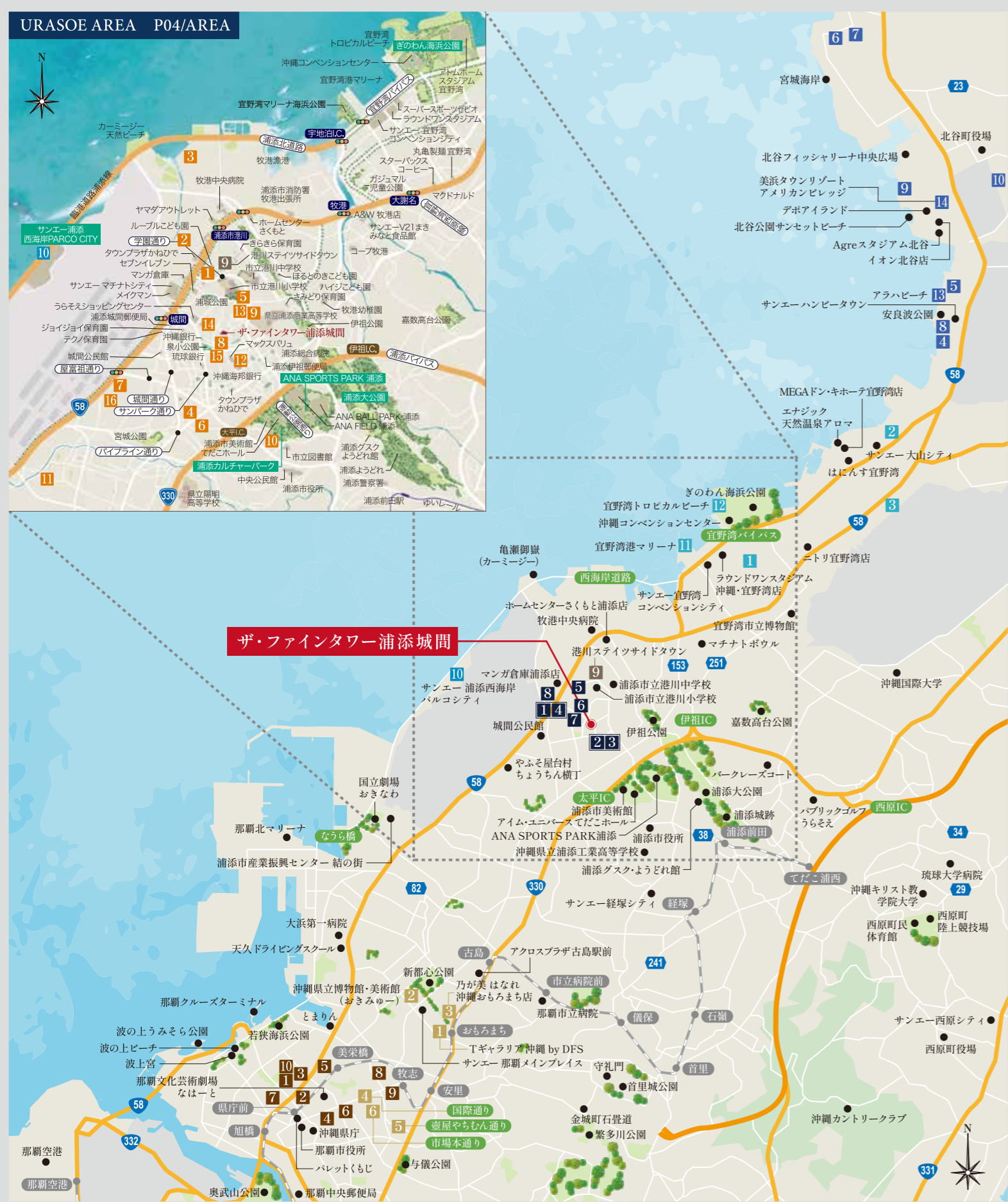
※掲載の地図は略図につき、省略している道路・施設等があります。

事業主(売主) KEIHAN 京阪電鉄不動産 事業主(売主) 株式会社 サンキョウホーム 事業主(売主) 株式会社 JUN企画 販売提携(代理) 長谷工 アーベスト