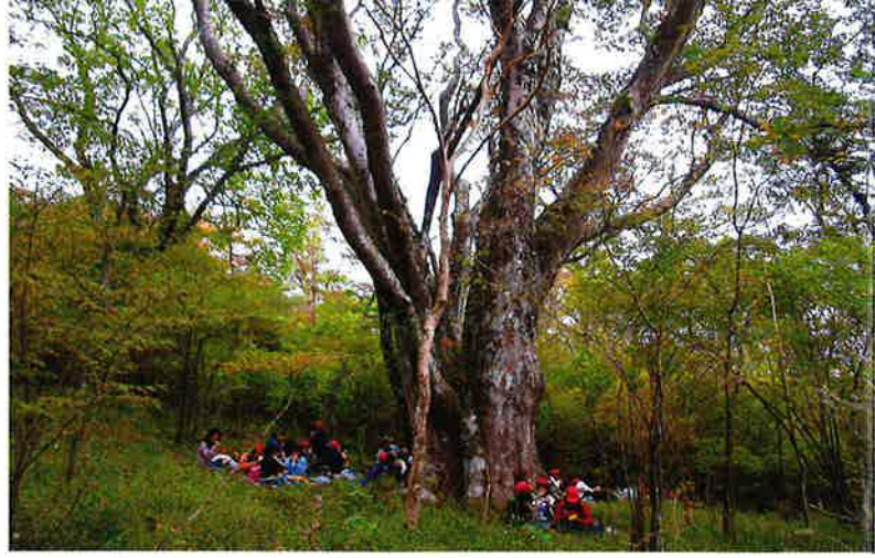
ケヤキの大木の下で、インストラクターと語る小学生たち。