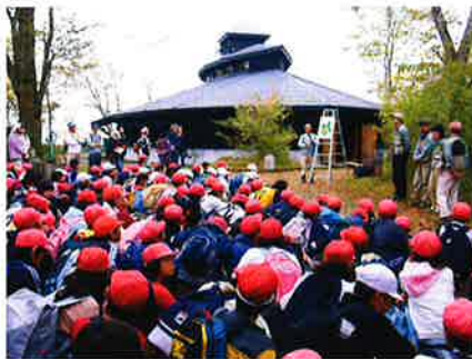
森に入る前に、注意事項の説明を受ける大富士小学校の生徒たち。後方の建物は、ボランティアのための施設「フォレストアーク」。

どもたちが自然に溶け込んでいく様子が伺える。慣れてきた子どもたちは、古木の穴から出てきたキツツキを見つけたり、「ヤマネだ」と言って追いかけて飛び回る本能的な鋭さも現れてくる。人間が持って生まれた五感は、子どもの時であれば理屈抜きで養われていくことがわかる光景だ。