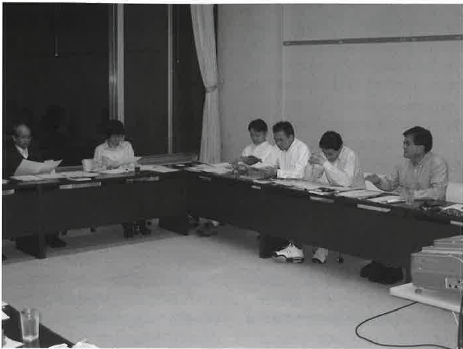
企画部会で、これまでの活動と今後の展開について討議(人材開発センター富士研修所にて)。