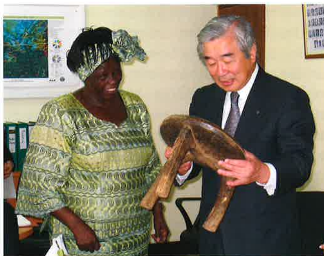
マータイさんから3本脚の道具を渡される。