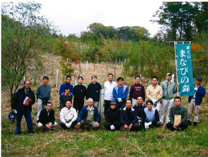
スタディーツアーに参加した皆さん。後ろが企画部会の記念植樹場。