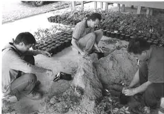
現地にてポット苗を作っている様子。