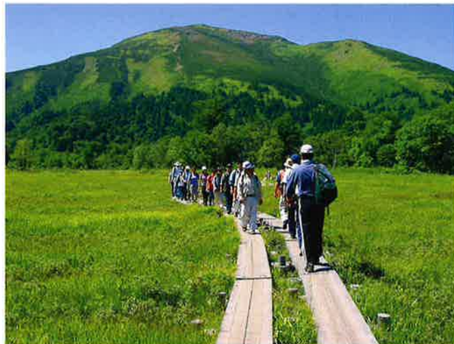
尾瀬の湿原に敷かれた木道。東京電力は、その敷設・維持に取り組んでいる。

言葉は、私たち人間にとってお互いのコミュニケーションを図るのに最も有効な手段です。しかし、言葉だけでは意思疎通がうまくいかないことも多くあります。言葉では伝えられない思いをいかに相手に届けるかで悩むのが人間です。むしろ言葉を持たない動植物の方が、巧みにコミュニケーションを図っているように思えることがあります。動物との触れ合いが人の心を癒す効果を持っていることは広く知られています。植物も、人間が話しかけたり音楽を聴かせたりすると生育が良くなるという経験談を聞いたことがあります。同じ生き物として、人と自然のコミュニケーションを重ねることで、私たちの生活はより一層豊かなものとなるのではないのでしょうか。