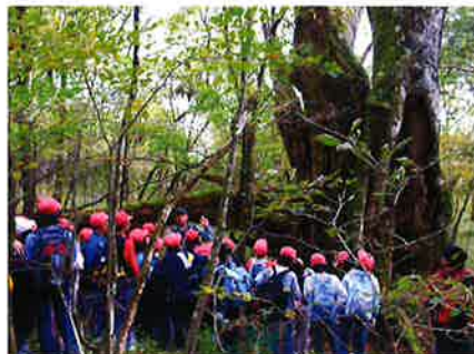
ブナの巨木が倒れたところで、森の循環系を学習する。

物などによる食物連鎖を通じて土となり、森の栄養分となって、再び森の一員に生まれ変わる様子を、子どもたちと一緒に語りあう。自然の循環システムを現物を見ながら互いに考え合うことができる重要な一コマだ。