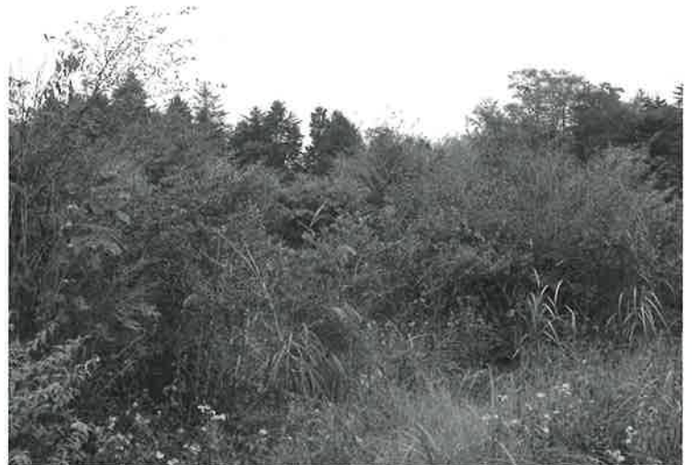
「富士山自然の森づくり」が9年前に行った植林地の現在の様子。