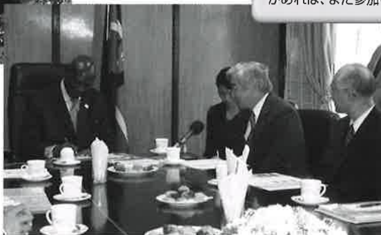
アオリ副大統領を表敬訪問。