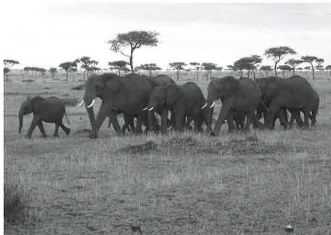
サバンナでゾウの群れに出会う。