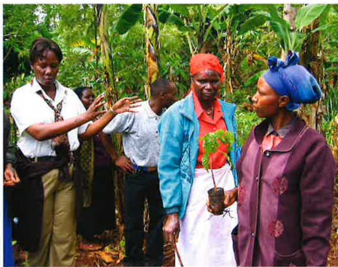
グリーンベルト運動の活動地で説明を受ける。

また、地域住民との関係については、とても難しく、貧しい人は生き残ることしか考えない。フォローアップセミナーなどで、なぜそれが重要なのかを啓発することが大事であるとの考えである。また、ハチミツやヤギ、衣服用の機械や特殊なストーブの導入を図るなどして収入を得る方法を考える必要がある。「これらのことを行ってくるのに30年間かかった」との言葉には重みがある。団員からは、植林と平和について「現場に来て、それぞれがつながっていることがよく分かった」「地元の樹種を植えていることに感心した」などの感想が述べられた。GBMでは固有種を植えるキャンペーンを進めており、今回、国連環境計画(以下、UNEP)