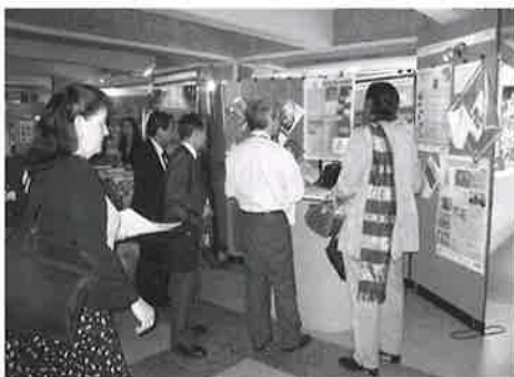
国連で開かれたCOP12会場を見学。

今回得たことを家族や社内に伝え、広めていき、今後とも自然保護活動に積極的に取り組んでいきたいと思う。