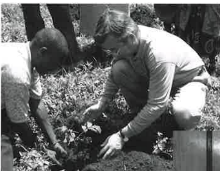
グリーンベルト運動の活動地で植樹。

最近、「北京の蝶」という言葉をよく聞かすが、アフリカの、ケニアの、マサイマラの、世界地図におけるほんの一点の個所での自然保護活動が、世界の自然保護活動の原動力になれることを今回のミッションで確信させていただいた。