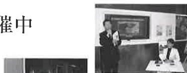
PIC東京で開かれたパネル展の様子。

※詳細は、世界銀行東京事務所のホームページ( http://www.worldbank.org/japan/jp )で、皆様のご来場をお待ちしています。