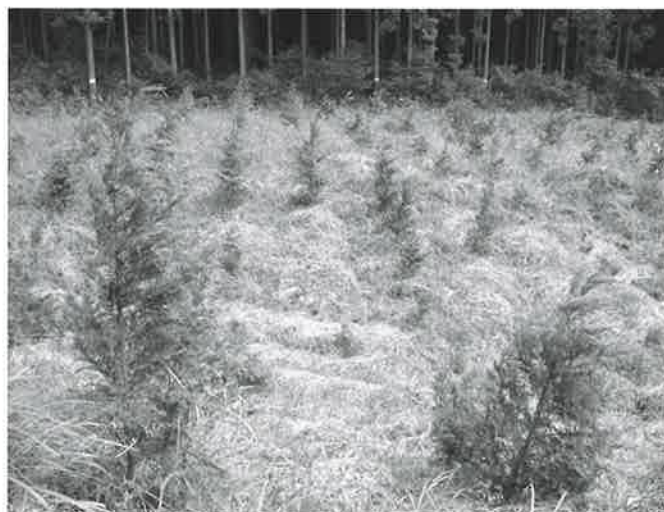
「ニッセイ100万本の植樹運動」の目標を達成し、記念植樹された現場。