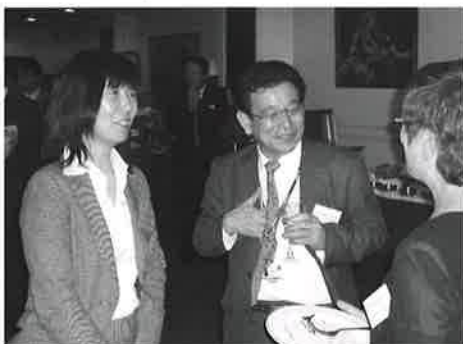
現地で活動するNGOらとの交流会。