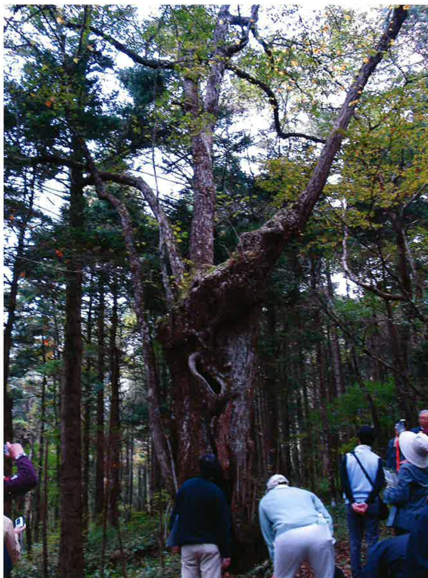
巨木にできた空洞に皆興味津々。