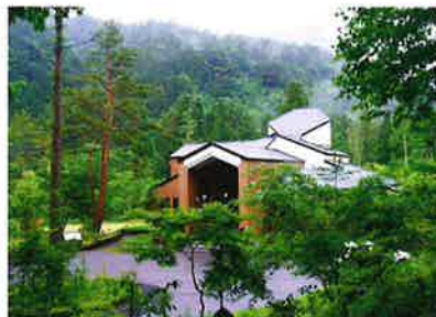
住友林業別子山社有林(愛媛県)内にある「住友の森エコシステム」のビジターセンター「フォレスタワーハウス」。

この大造林計画樹立100周年を記念して、1993年、別子山中七番山林に「住友の森エコシステム」が設けられ、その一部を市民に公開、ビジターセンター「フォレスタワーハウス」が開設されている。ここでは「ナチュラルゲメス」の考え方を広めるとともに、「保続林業」という持続可能な森林経営と自然環境の調和を市民とともに考え、これからの社会にふさわしい森林文化を発信する基地としての活動が続けられている。