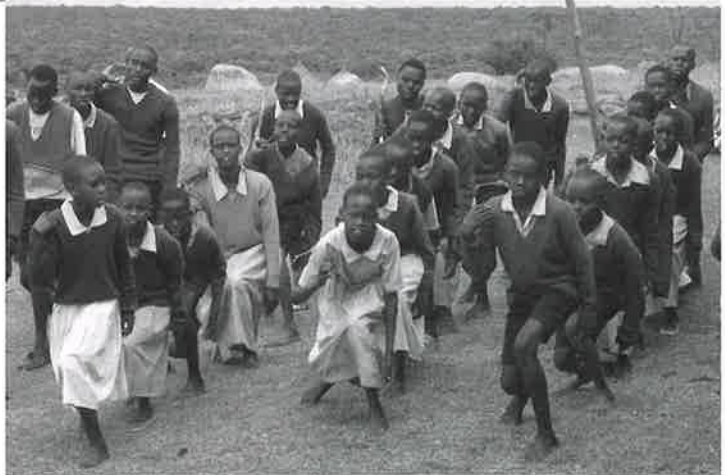
マサイ族の子どもたちが踊りて一行を歓迎してくれた。