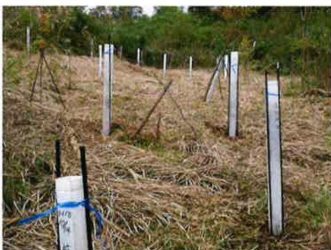
ヘキサチューブを被せた苗木。