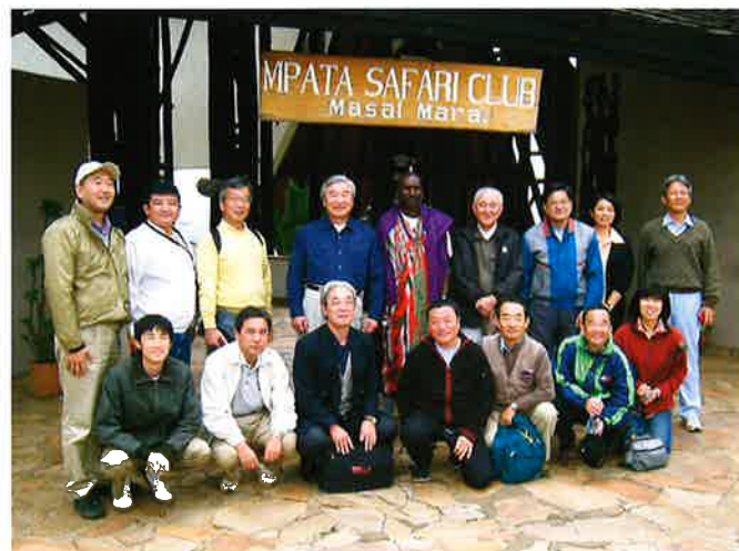
ミッション参加メンバー。

気候変動枠組条約会議(以下、COP12)は政府間ベースの会合ではあるが、温暖化に関する国民の関心も強く、産業界としても自主行動計画を立てて温室効果ガス削減に取り組んでおり、日本経団連も毎年、オブザーバー参加を行っている。自然保護協議会としても、この時期にナイロビを訪問し、自然保護の立場から気候変動への取り組みを考え、その雰囲気を感じたいと思った。そのようなことでアフリカ訪問を判断し