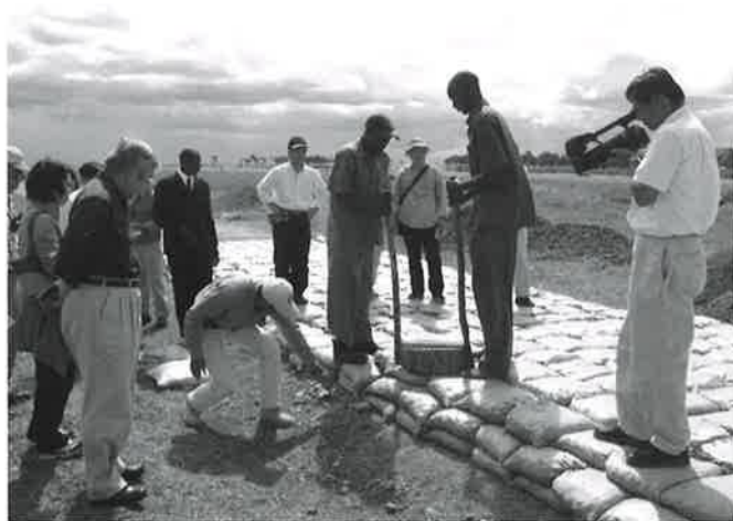
マサイマラでのサファリロードの施工テスト。

本プロジェクトの最終年にあたる2007年度は、対象地区の2km区間で整備工事を実施する。整備後には効果を測るモニタリングの他、適正な道路の利用ルール、コントロールのあり方などについて、ガイド・ドライバーへの普及プログラムを行う予定である。また、土のう袋を現地で、安価かつ安定的に調達していくことも今後の課題である。完成の際には、また視察グループのご一行に來訪いただき、一緒に成功を祝いたいと願っている。