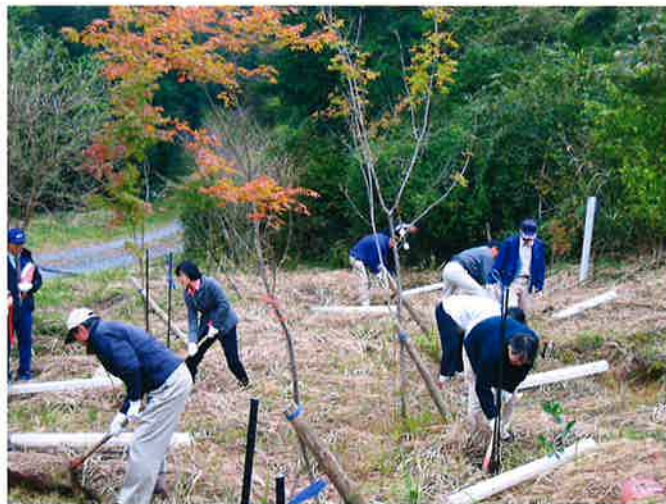
企画部会一行による記念植樹。