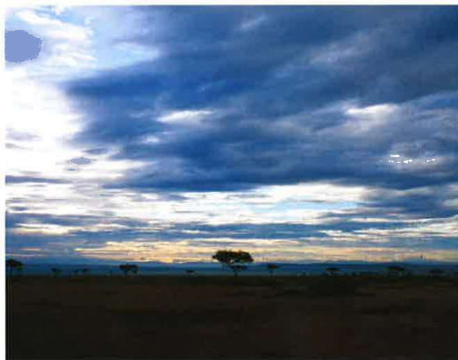
地平線の彼方まで広がるマサイラの風景。