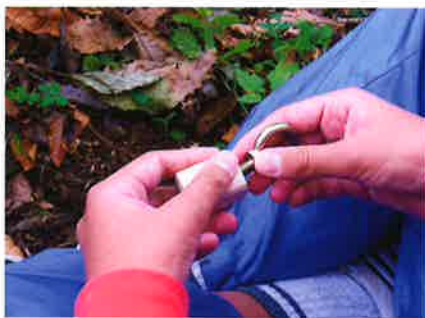
さまざまな鳥の鳴き声が表現できる「バード・コール」。

「まなびの森」問い合わせ先 〒100-8270 東京都千代田区丸の内1-8-1(丸の内トラストタワーN館) 住友林業株式会社 環境経営部内 「まなびの森」実行委員会事務局 TEL.03-6730-3520