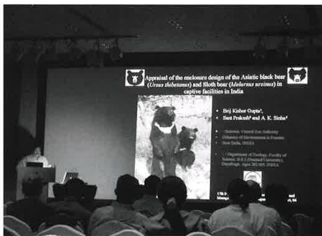
「クマと人の軋轢」ワークショップでの各国参加者による発表の様子。