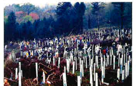
台風被害にあったヒノキ林(写真上/1996年秋)。台風跡地で活躍する植林ボランティア(写真下/1998年春)。1日に400人以上の人が植林に協力。白く見える筒は、苗木をシカの食害から防御するツリーシェルター。