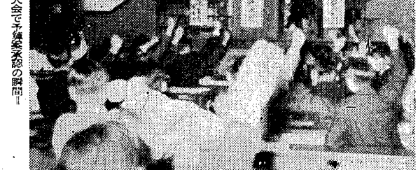
学生会第一回大会の様子。

本学二十八年度決算書が、本年度第一回学生会大会で否決された。学生会は、決算書の採否をめぐり、激しい議論が行われ、最終的に否決の議決された。