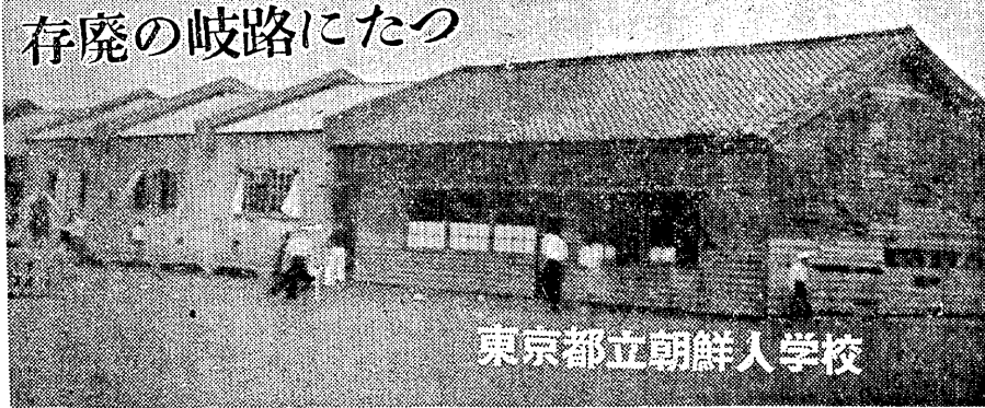
東京都立朝鮮人学校

【本報東京14日通信】東京都教育委員会が、朝鮮人子弟の民族教育を制限する旨の通告を出した。通告は、都立朝鮮人学校に在籍する朝鮮人子弟の民族教育を制限する旨の通告を出した。通告は、都立朝鮮人学校に在籍する朝鮮人子弟の民族教育を制限する旨の通告を出した。 通告の要旨は、(一)民族教育の制限(二)民族教育の制限(三)民族教育の制限(四)民族教育の制限(五)民族教育の制限(六)民族教育の制限(七)民族教育の制限(八)民族教育の制限(九)民族教育の制限(十)民族教育の制限(十一)民族教育の制限(十二)民族教育の制限(十三)民族教育の制限(十四)民族教育の制限(十五)民族教育の制限(十六)民族教育の制限(十七)民族教育の制限(十八)民族教育の制限(十九)民族教育の制限(二十)民族教育の制限(二十一)民族教育の制限(二十二)民族教育の制限(二十三)民族教育の制限(二十四)民族教育の制限(二十五)民族教育の制限(二十六)民族教育の制限(二十七)民族教育の制限(二十八)民族教育の制限(二十九)民族教育の制限(三十)民族教育の制限(三十一)民族教育の制限(三十二)民族教育の制限(三十三)民族教育の制限(三十四)民族教育の制限(三十五)民族教育の制限(三十六)民族教育の制限(三十七)民族教育の制限(三十八)民族教育の制限(三十九)民族教育の制限(四十)民族教育の制限(四十一)民族教育の制限(四十二)民族教育の制限(四十三)民族教育の制限(四十四)民族教育の制限(四十五)民族教育の制限(四十六)民族教育の制限(四十七)民族教育の制限(四十八)民族教育の制限(四十九)民族教育の制限(五十)民族教育の制限(五十一)民族教育の制限(五十二)民族教育の制限(五十三)民族教育の制限(五十四)民族教育の制限(五十五)民族教育の制限(五十六)民族教育の制限(五十七)民族教育の制限(五十八)民族教育の制限(五十九)民族教育の制限(六十)民族教育の制限(六十一)民族教育の制限(六十二)民族教育の制限(六十三)民族教育の制限(六十四)民族教育の制限(六十五)民族教育の制限(六十六)民族教育の制限(六十七)民族教育の制限(六十八)民族教育の制限(六十九)民族教育の制限(七十)民族教育の制限(七十一)民族教育の制限(七十二)民族教育の制限(七十三)民族教育の制限(七十四)民族教育の制限(七十五)民族教育の制限(七十六)民族教育の制限(七十七)民族教育の制限(七十八)民族教育の制限(七十九)民族教育の制限(八十)民族教育の制限(八十一)民族教育の制限(八十二)民族教育の制限(八十三)民族教育の制限(八十四)民族教育の制限(八十五)民族教育の制限(八十六)民族教育の制限(八十七)民族教育の制限(八十八)民族教育の制限(八十九)民族教育の制限(九十)民族教育の制限(九十一)民族教育の制限(九十二)民族教育の制限(九十三)民族教育の制限(九十四)民族教育の制限(九十五)民族教育の制限(九十六)民族教育の制限(九十七)民族教育の制限(九十八)民族教育の制限(九十九)民族教育の制限(百)