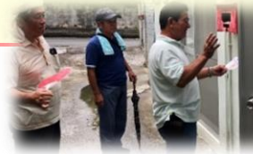
チラシ配布訪問活動