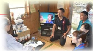
見守り活動の様子