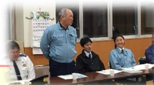
警察署・消防署、役場職員との情報共有