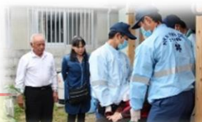
見守り隊模擬訓練