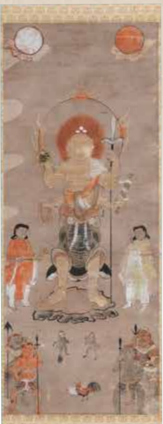
「庚申青面金剛御姿図」