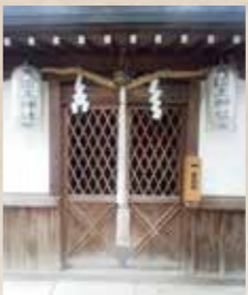
御祭神・大国主命