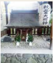
御祭神・火伏の神秋葉明神