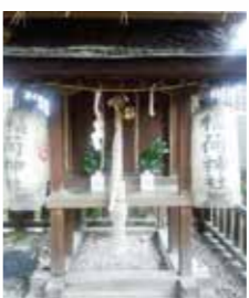
御祭神・稻荷大神