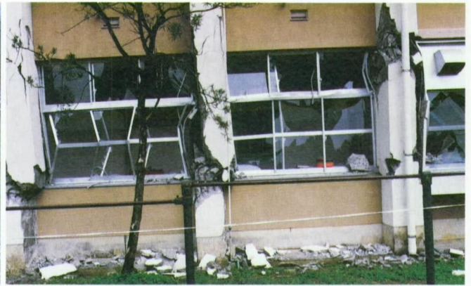
写真-6 崩壊した校舎(宮之城)(5月13日の地震)

岸が海側に傾斜し、数十センチメートルの段差が発生した。また写真-4に示すように漁港の荷揚場のエプロンは大きく波打つように沈下した。海砂の浚渫等によって埋め立てられた新港では液状化に伴う噴砂の後が見られた。阿久根市の他の地域では大きな被害は発生しておらず、阿久根漁港の被害はその多くが地盤の影響を強く受けたものであることが考えられる。5月13日の地震では新たな被害の増大は見られなかった。