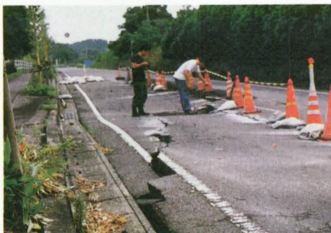
写真-1 国道328号線宮之城町付近に発生した亀裂(5月13日の地震)