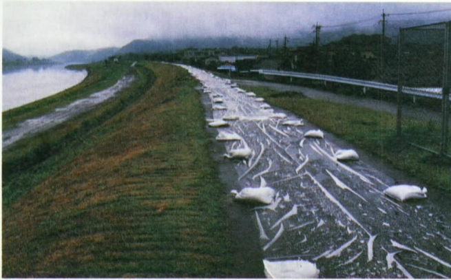
写真-5 亀裂の発生した川内川の堤防(雨に備えてシートで覆って有る)