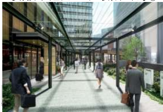
歩行者デッキ上アプローチ「多摩川ペイブ」①