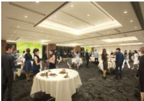
大会議室（パーティー利用イメージ）