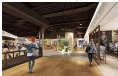
カフェ&レストラン

カフェ&レストラン（約2,500㎡）と大型フィットネス&スパ（約4,000㎡）で構成され、街区全体完成の後に順次開業予定です。