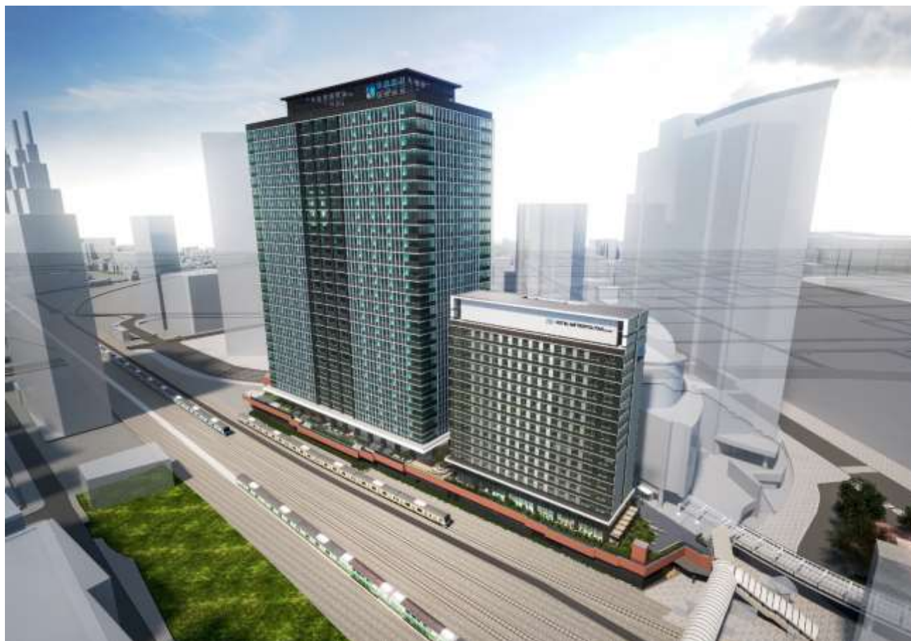
外観イメージ（鳥瞰）

この度、本計画地全体の街区名称を「KAWASAKI DELTA（カワサキデルタ）」に決定し、2021年4月に全体完成を迎えます。街区内は「JR川崎タワー オフィス棟・商業棟」と「ホテルメトロポリタン 川崎」、歩行者デッキ上の中央広場「デルタプラザ」による構成とします。