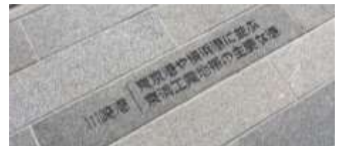
「川崎・多摩川タグ」床刻印例 (多摩川ペイブ上に配置)