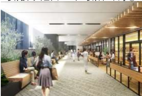
歩行者デッキ上アプローチ「多摩川ペイブ」③