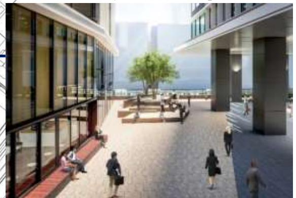
中央広場「デルタプラザ」