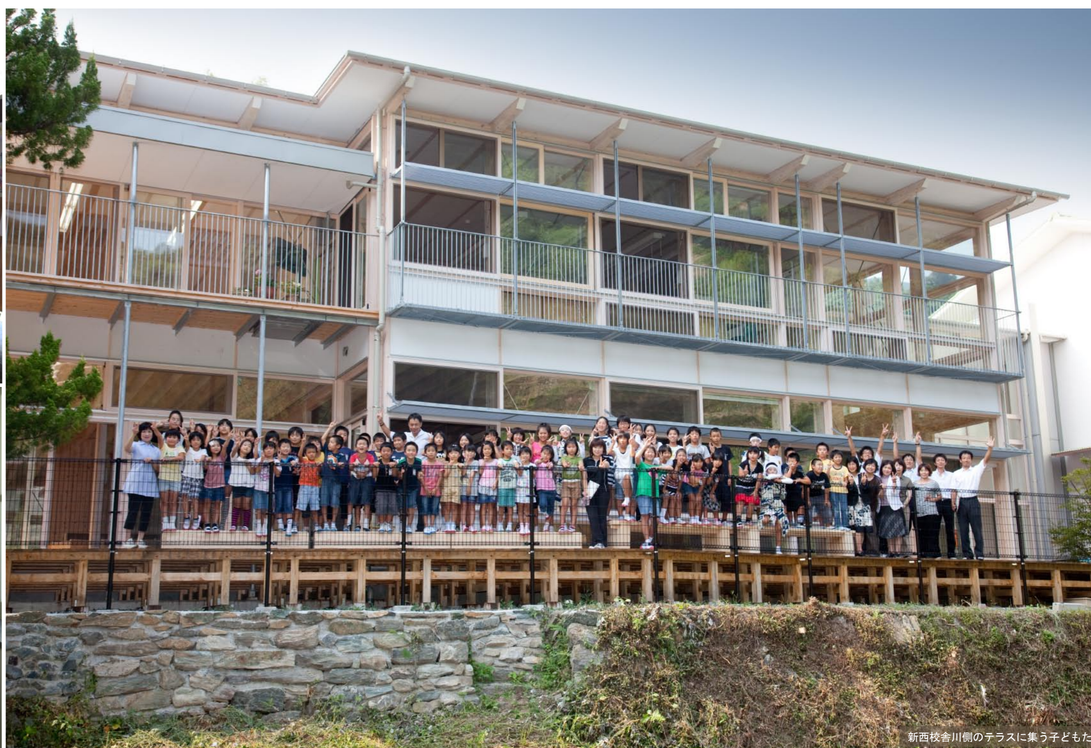
新西校舎川側のテラスに集う子どもたち