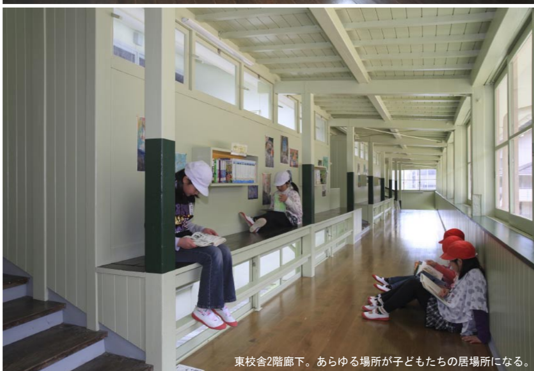
東校舎2階廊下。あらゆる場所が子どもたちの居場所になる。