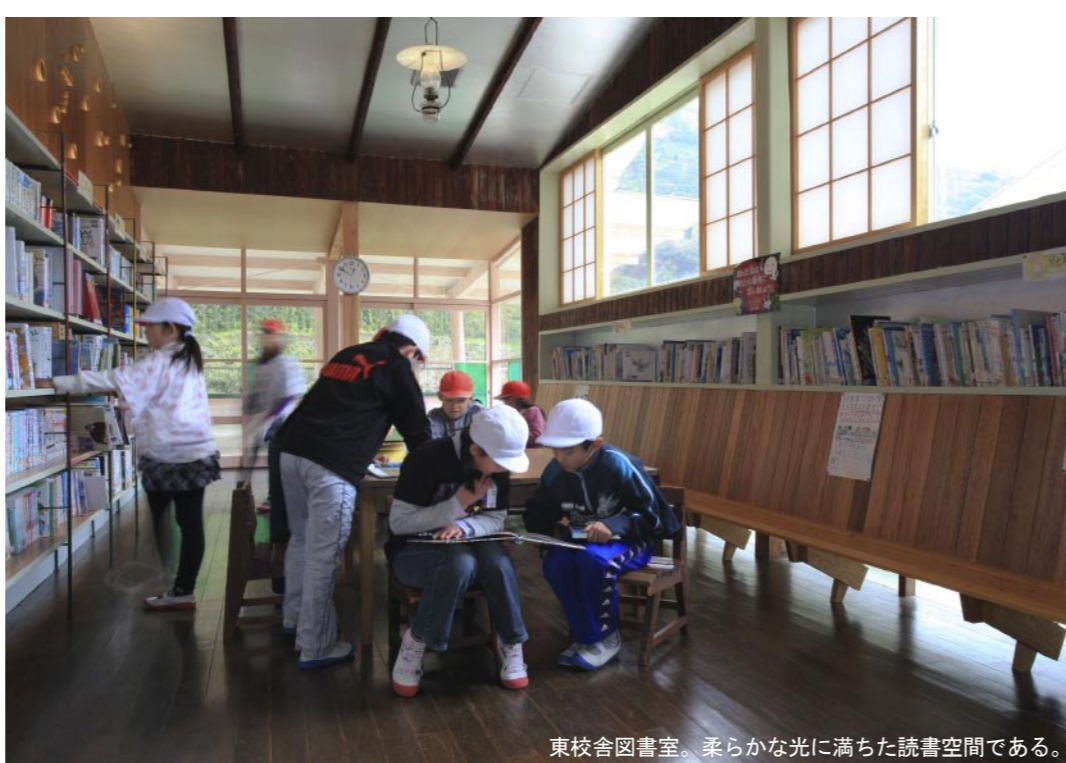
東校舎図書室。承らなかに満たした読書空間である。

日土小学校の保存再生は、貴重な職後の木造モダニズム建築の持続的な活用を達成した最初の仕事といえる。またそのことを通じて地域の歴史や文化も継承され本来の意味で豊かな生活空間が形成できるという事実を示すとともに、そのような価値観の重要性を主張したものである。