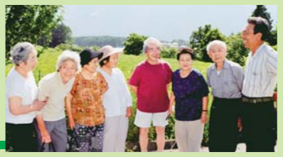
子どもと高齢者の「医療費無料」を実現している長野県原村で

「患者のためという点では共産党とはまったく一緒」(千葉県医師会長)——日本共産党の提案に共感がひろがっています。