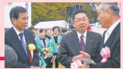
JA東京中央会の役員と懇談する小池あきら党政策委員長・参院議員