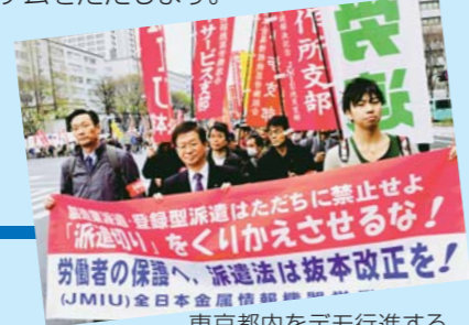
東京都内をデモ行進する労働組合の人びと＝4月7日

「最低賃金引き上げは最大の経済戦略」(富士通総研)——財界シンクタンクの提起も、共産党と一致しています。