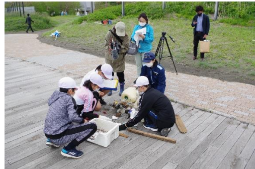
6. 5月31日 海浜清掃・漂着ゴミ調査 (青森県鱒ヶ沢町)