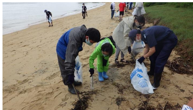
51. 6月19日 長崎ノ鼻海浜清掃 (香川県高松市)