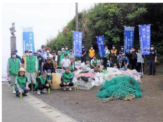
18. 6月5日 茂串海岸清掃活動 (熊本県天草市)