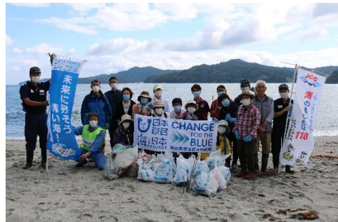
43. 9月25日 釜石市片岸海岸清掃活動 (岩手県釜石市)