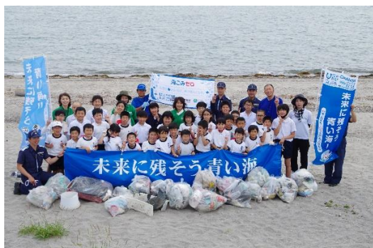
9. 6月2日 前之浜海岸清掃・漂着ゴミ調査 (鹿児島県鹿児島市)