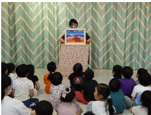
12. 6月11日 かまいしこども園海洋環境教室 (岩手県釜石市)