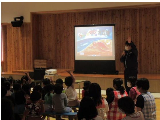
35. 6月29日 広尾保育園海洋環境教室 (北海道広尾町)