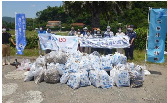
2. 5月30日 吉佐美大浜ビーチクリーン活動 (静岡県下田市)