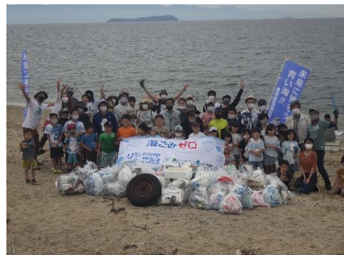
15. 6月5日 大浜海岸清掃 (香川県三豊市)