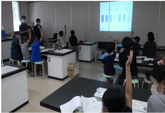
51. 7月27日 あこがれの海上保安官と一緒に (鹿児島県鹿児島市)