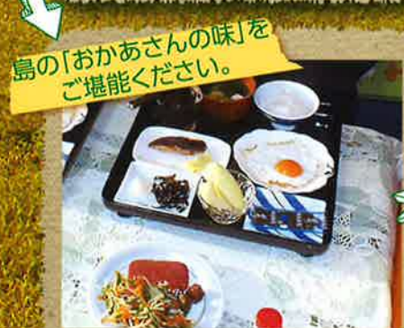
島の「おかあさんの味」をご堪能ください。