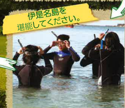
伊是名島を堪能してください。