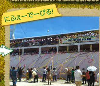
にふえーでーびる!