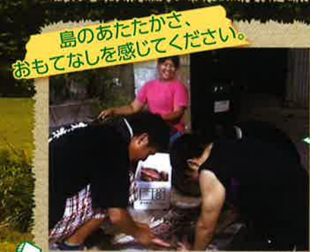
島のあたたかさ、おもてなしを感じてください。