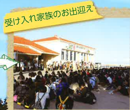
受け入れ家族のお出迎え