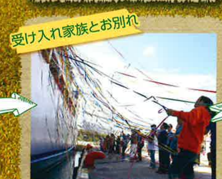
受け入れ家族とお別れ