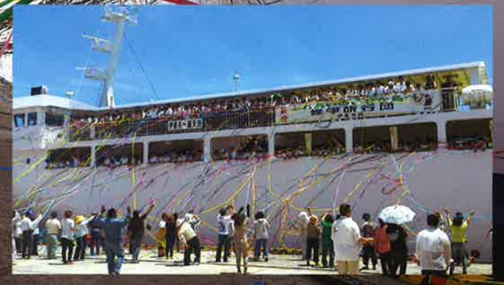
“にふえーでーびる” 沖縄の方言で「ありがとう」の意味

伊是名島へのアクセスは、仲田港-運天港(今帰仁村)を結ぶカーフェリーでの船旅となります。