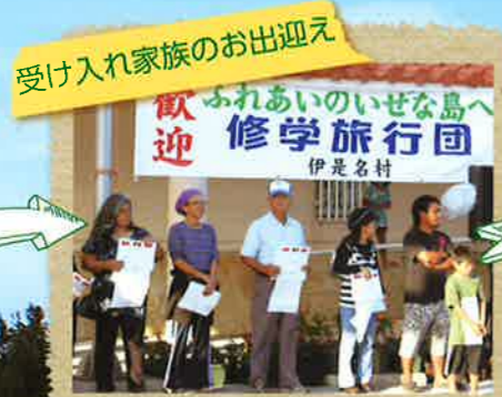
受け入れ家族のお出迎え