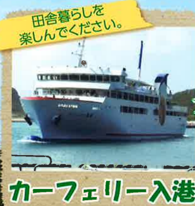
田舎暮らしを楽しんでください。

農作業や家畜への餌やり、田舎暮らしを思う存分楽しめ、海のレジャーもセットした様々な体験ができます。