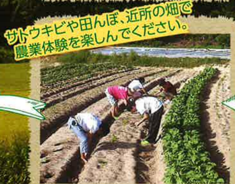
サトウキビや田んぼ、近所の畑で農業体験を楽しんでください。