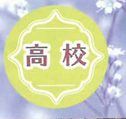
水戸市高総体開会式