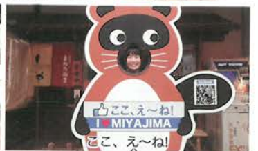
ここ、え〜ね! MIYAJIMA ここ、え〜ね!