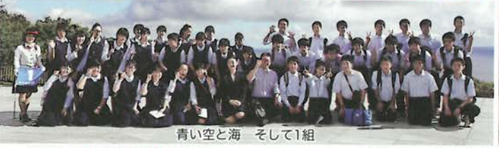
青い空と海 そして1組