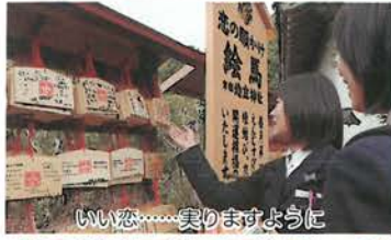
いい恋……実りますように