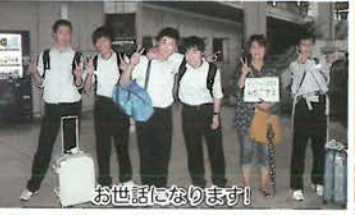
お世話になります!