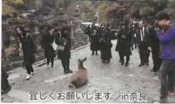
宜しくお願いします in奈良