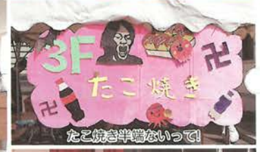
たこ焼き半精ないっで!