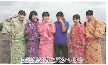
民泊先の方とバシャリ☆