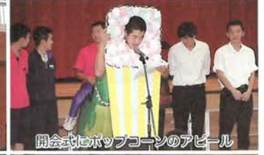
開会式にポップコーンのアピール