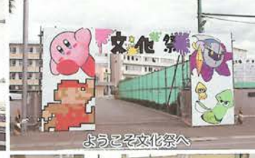
ようこそ文化祭へ