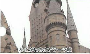
おとがれのホグワーツ城