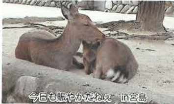
今日も賑やかだねえ in宮島