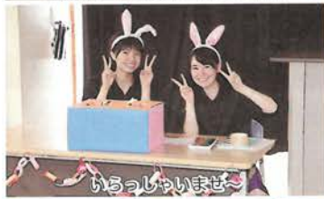
いらっしやいませ〜