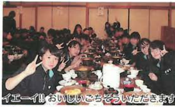
イエーイ!! おいしいごちそういただきます