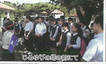
ひめゆりの塔の前にて