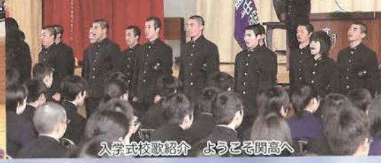
入学式校歌紹介 ようこそ関高へ