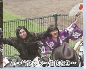
あ～愉快なり～愉快なり～