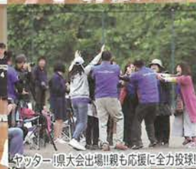
キャッター!県大会出場!!親も応援に全力投球!!