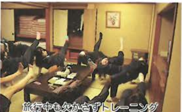
旅行中も欠かざるトレーニング