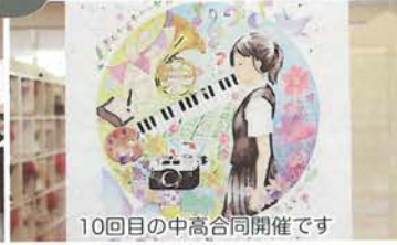
10回目の中高合同開催です