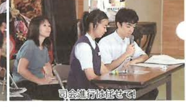
司会進行は任せて!