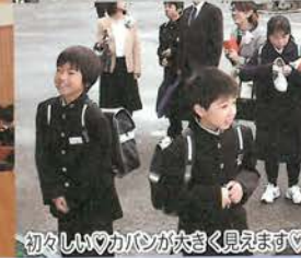
初々しいカバンが大きく見えます♡