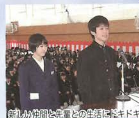
新しい仲間と先輩との生活にドキドキ