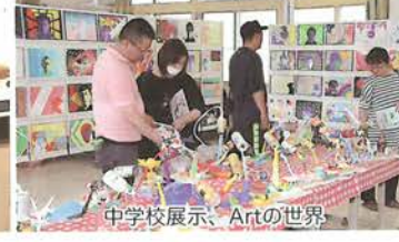
中学校展示、Artの世界