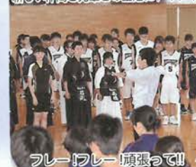
フレー!フレー!頑張ってる!!