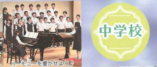
ハーモニーを響かせよう♪