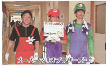
スーパーマリオブラザーズ