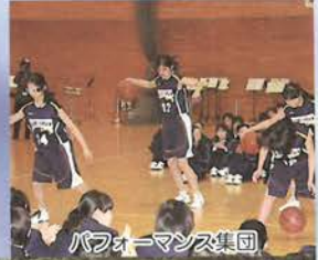
パフォーマンス集団