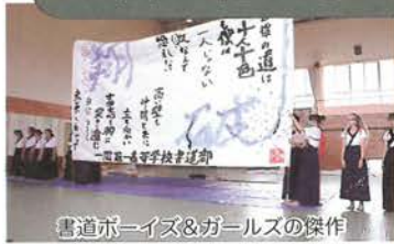
書道ボーイズ&ガールの傑作