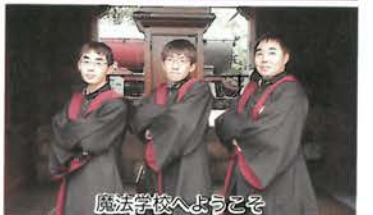
魔法学校へようこそ