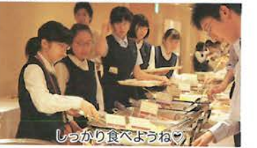
しっかり食べようね♡