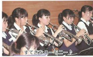
すてきなハーモニー