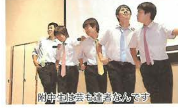
附中生は芸も達者なんです