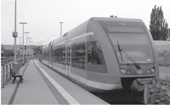
写真1 コールバッハ駅で折り返しブリロンへ向かうR55路線の列車