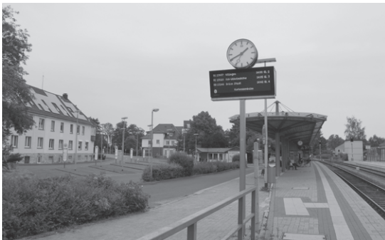
写真3 地域の交通結節点となるコールバッハ駅と駅前バスセンター

廃止はもちろんのこと、その枝葉となるバス路線の再編も行われた。中山間地域や地方都市圏では乗換時の各路線の接続の善し悪しが利便性を大きく左右するため、鉄道との接続を前提としたバスの運行や、乗換しやすい駅構造とするなどの工夫により乗換抵抗の軽減を図っている。