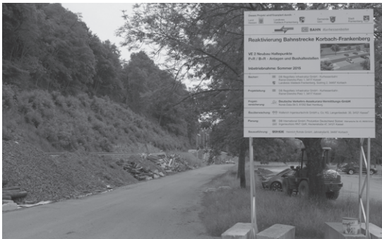
写真2 9月中旬の開業に向け工事が進むヘルツハウゼン駅前