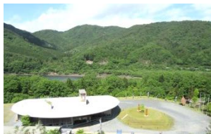
カンパネラの館（いえ）

安芸高田市の土師ダム湖畔にある 八千代校舎 。 自然はたくさんの新しい 発見 や 驚き 、そして 感動 を与えてくれます。ぜひ、みなさんが生まれながらに持っている 五感 （視覚、聴覚、味覚、臭覚、触覚）のすべてをこの 八千代の森 で使ってみませんか？