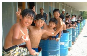
ドラム缶風呂体験

※体験の中には 大人数や年齢 、または 時期や道具の数 によっては 体験できないもの があります。お問い合わせください。