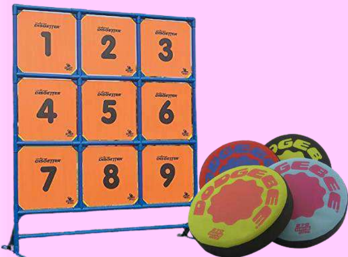
レク用品の無料貸し出し