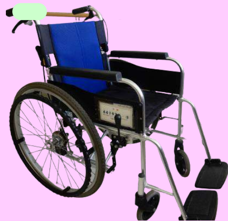
車いすの無料貸し出し