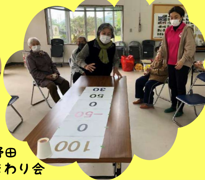
伊野田 ひまわり会