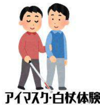
アイマスク・白杖体験