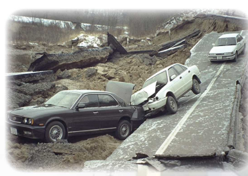
釧路沖地震 (1993) 国道44号 糸魚沢道路が崩壊