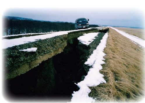
釧路沖地震 (1993) 釧路川右岸築堤 車が立ち往生