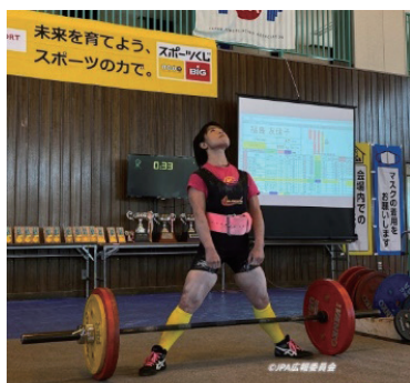
155kgに挑戦前に集中する友佳子選手