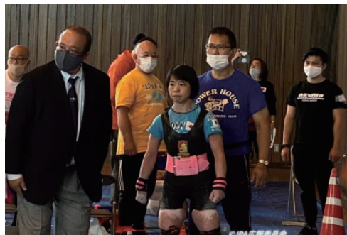
友佳子選手のセコンドをする和文選手