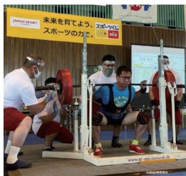
230kgのバーベルをスクワットする和文選手