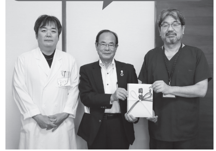
じのーん整形外科クリニック 様