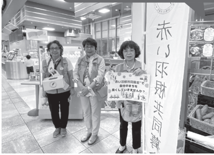
更生保護女性会の皆さん