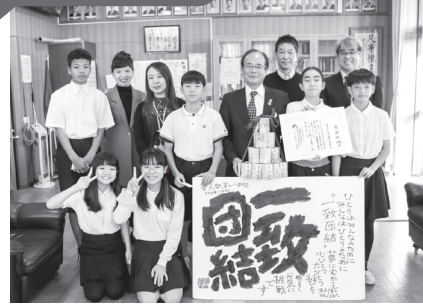
普天間第二小学校の皆さん