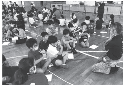
普天間第二小学校