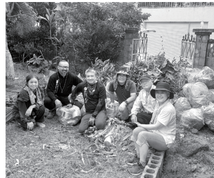
④お手伝い活動（草刈り）