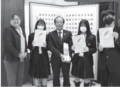
中部商業高校生徒会の皆さん