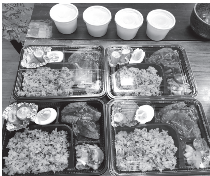
③配食型見守りのお弁当