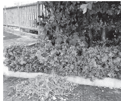
②花植え・美化清掃活動