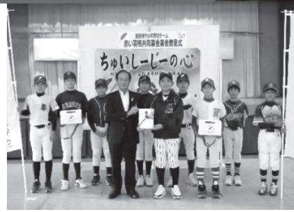
宜野湾スポーツ少年団の皆さん