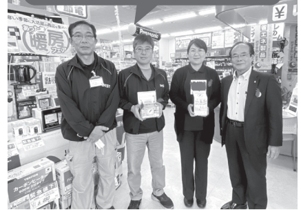
ベスト電器長田店 様