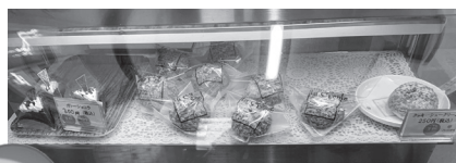
おかしランド(12月加盟しました)