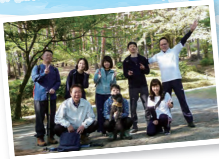
今年4月、「野坂山」に登りました