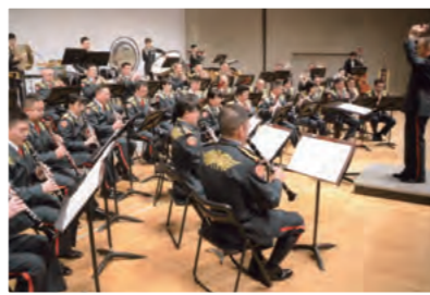
定期演奏会での一コマです

卒業後、楽器メーカーを経て、2年後に陸上自衛隊に入隊。伊丹市に駐屯する第3音楽隊を中心に36年勤務し、来年2月に退官予定です。フルート奏者や歌手、司会者、演奏会・訓練の企画担当などを経験後、総務班長となった現在は、行政文書管理を含む総務業務の責任者を務めています。