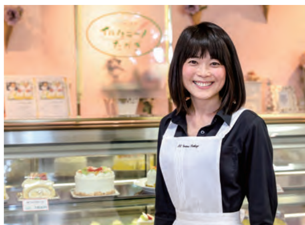
地元の食材を取り入れた、おいしくてヘルシーなお菓子を考案

イルグラノたかぎ 〒923-1101 石川県能美市粟生町ツ56 TEL: 0761-57-0263 FAX: 0761-58-5658 HP: http://www.ilgrano-takagi.com 営業時間 ショップ / 9:00 ~ 21:00 レストラン / 11:00 ~ 20:30 (L.O) 定休日: 火曜日