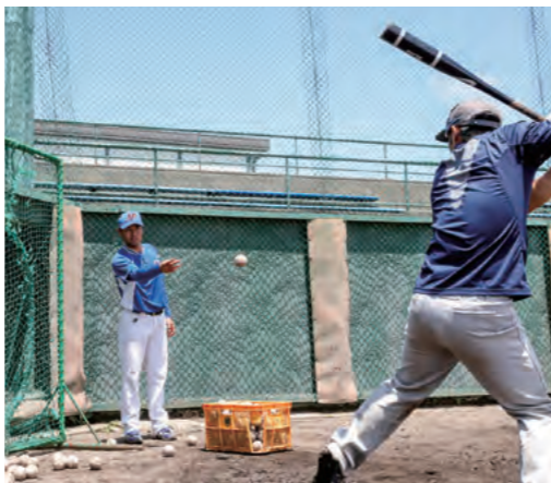
基本に忠実に、一人ひとりに合わせた指導がモットー

Profile 石川県金沢市出身。平成18年経営学部事業構想学科卒業。在学中は硬式野球部のレギュラーとして活躍。母校の監督を志し、卒業後は「茨城ゴールデンゴールズ」でプレー。平成18年にBCリーグ「石川ミリオンスターズ」に入団し、2年で引退。コーチ、フロント職を経て、現在は野手総合コーチ。